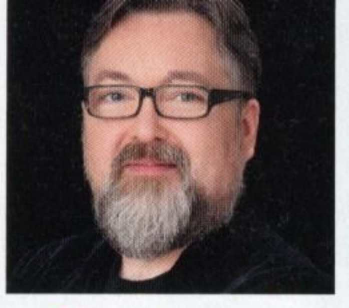
Par Steve Martin

IL SE LIVRE DANS SA BIOGRAPHIE IMPROVISATIONS LIBRES