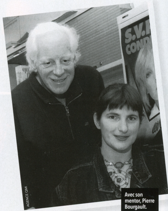
Avec son mentor, Pierre Bourgault.

probablement retournée aux études en architecture. J'aurais aimé créer, construire, imaginer des lieux où les gens vivent, travaillent, et essayer de faire de belles choses, de rendre la vie plus agréable, de mélanger les besoins individuels en une vision plus collective.