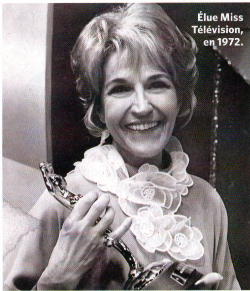
Élue Miss Télévision, en 1972.