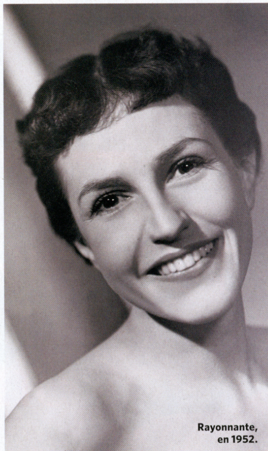
Rayonnante, en 1952.

Elle n'a que 14 ans lorsque, en 1935, elle prête sa voix et son talent à des feuilletons radio, dont Vie de famille et Clémentine . Cette opportunité, elle la doit au comédien et animateur Guy Mauffette, un ami de son frère qui lui présentera un certain Félix Leclerc, qui sera son voisin pendant plusieurs années à Vaudreuil, dans les années 1950 et 1960. Diplômée en lettres et sciences de l'académie Saint-Urbain en 1939, elle signe parallèlement quelques textes pour La Revue moderne , mais ses propos féministes dérangent et elle est rapidement exclue de la publication. Si cette incursion dans le monde de l'écrit se solde par un échec, sa carrière de comédienne commence à prendre forme. Grâce à son français soigné et à son énergie communicative, elle se fera connaître peu à peu des amateurs