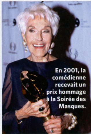
En 2001, la comédienne recevait un prix hommage à la Soirée des Masques.

culturelle québécoise, canadienne et francophone lui a valu de nombreuses distinctions au cours de sa carrière, qui s'est étendue sur huit décennies. Reçue d'abord Officier de l'Ordre du Canada (1986), Compagnon (1992), Chevalier de l'Ordre National du Québec (1998), puis de l'Ordre des Arts et des Lettres en France (2013), Janine Sutto a mérité un ultime hommage en 2014: le Prix du Gouverneur général pour les arts de la scène. Malgré les accolades, M me Sutto est demeurée humble, voire critique envers cette carrière pourtant parsemée de succès. «Quand je fais le bilan, a-t-elle confié lors d'un reportage dans le magazine Châteline , le mot "réussite" ne me vient pas en tête. Je