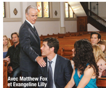
Avec Matthew Fox et Evangeline Lilly

qui nous fait avaler la pilule et donne trop de réponses sans rien ajouter. Dommage. C