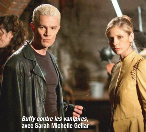
Buffy contre les vampires, avec Sarah Michelle Gellar