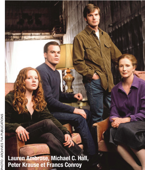
Lauren Ambrose, Michael C. Hall, Peter Krause et Francs Conroy

Difficile, quand on entend Still Loving You , des Scorpions, de ne pas se remémorer cette finale qui nous a hantés pendant plusieurs jours au printemps 2009. Les quatre amis, qui sont à la croisée des chemins, se quittent. P.A., l'égocentrique, part en Haïti afin de faire du travail humanitaire; Rémi, l'irresponsable, s'inscrit à l'université; Steve, l'explorateur, accepte sa bisexualité; et Carlos, le mythomane, qui est au chevet de sa Lyne, apprend la mort de celle qui vient de donner naissance à son enfant. Désespéré, il appelle ses amis, qui choisissent de ne pas répondre. Poursuivi par une soucoupe volante, Carlos tente d'échapper aux amazones de l'espace qui le poursuivent jusque chez lui où, recroquevillé, il protège son enfant contre la reine des envahisseurs, qui veut le lui arracher. Si vous n'avez pas versé une larme lors de cette finale déchirante, c'est que vous avez un cœur d'androïde... A+