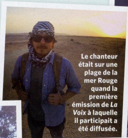
Le chanteur était sur une plage de la mer Rouge quand la première émission de La Voix à laquelle il participait a été diffusée.

Matt adore la musique, mais il a aussi une véritable passion pour les voyages. Celui qui vient de s'envoler vers le Guatemala a d'ailleurs accepté de partager quelques photos de ses derniers périples à l'étranger.