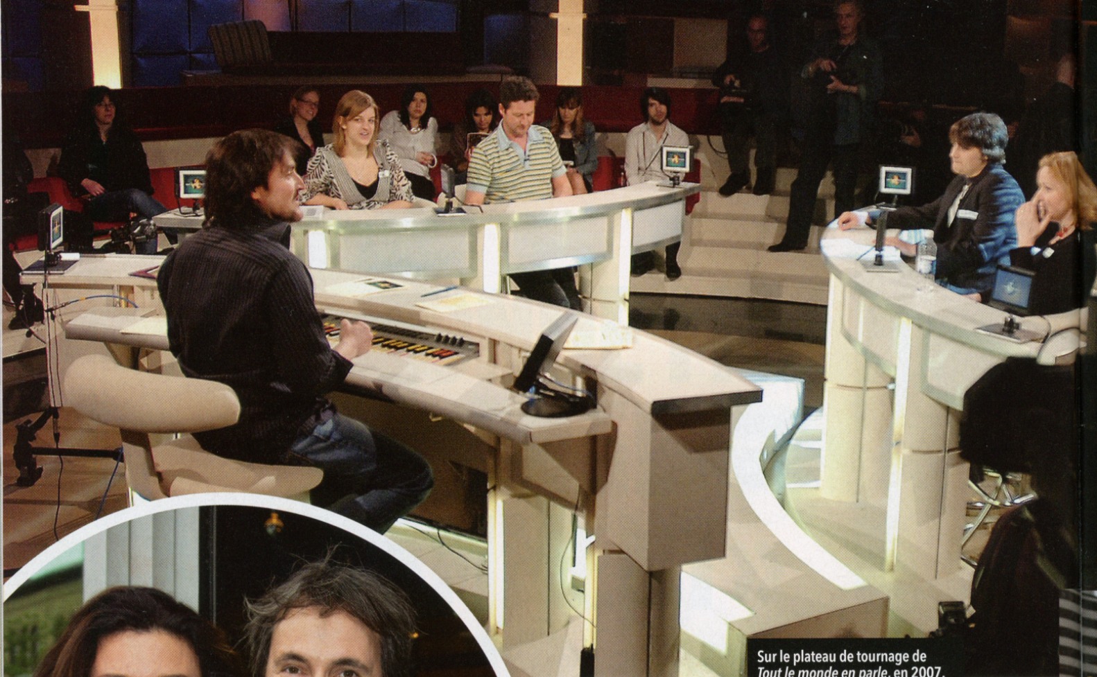
Sur le plateau de tournage de Tout le monde en parle , en 2007.