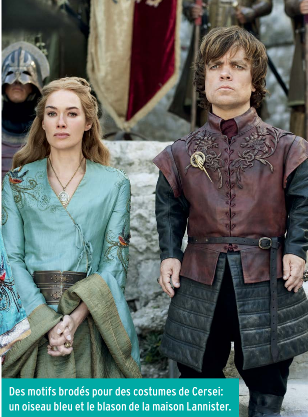
Des motifs brodés pour des costumes de Cersei: un oiseau bleu et le blason de la maison Lannister.

personnage auquel elle est destinée, de sa personnalité, de son statut et de son environnement. Dans Le trône de fer , chaque maison a son propre blason. Ces emblèmes sont très importants dans la création des designs. J'aime incorporer des métaphores, des significations cachées dans certains costumes. Je brode une image ou j'utilise un tissu après avoir mené des recherches et découvert quelque