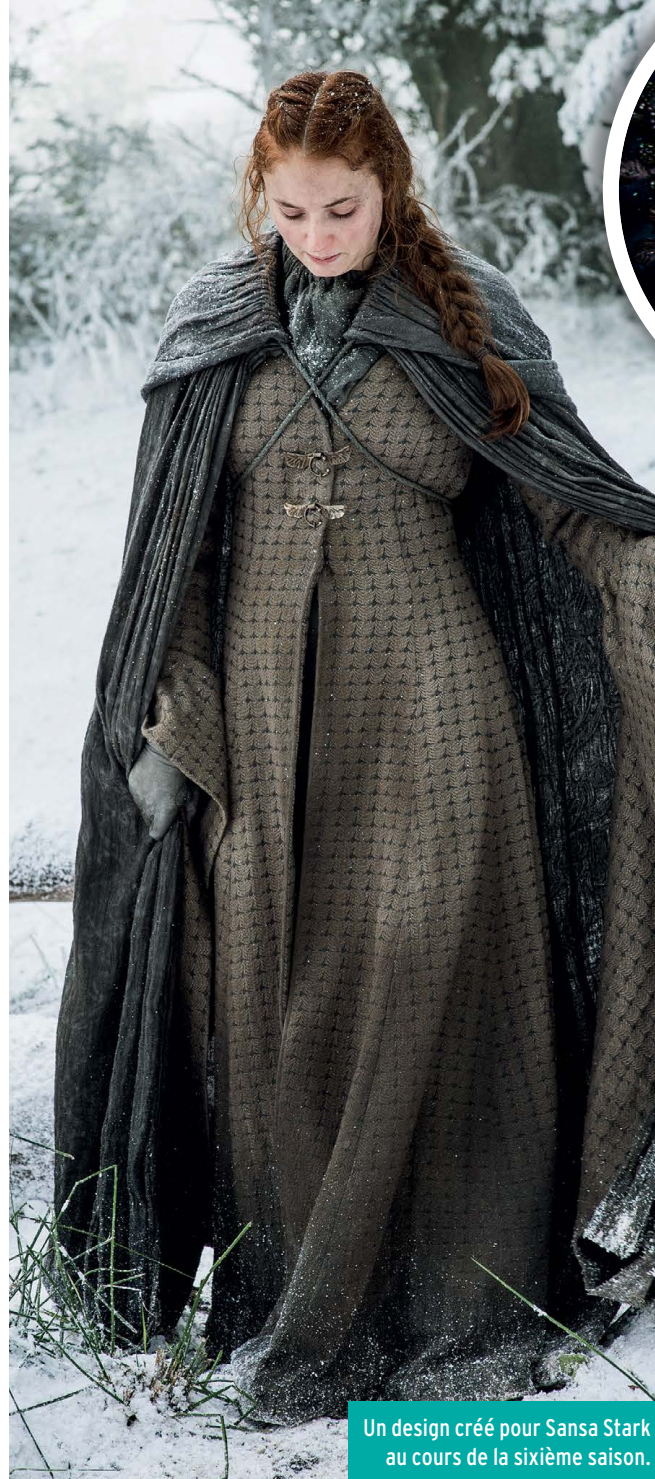
Un design créé pour Sansa Stark au cours de la sixième saison.

J'ai beaucoup de plaisir à travailler avec elle et avec les autres