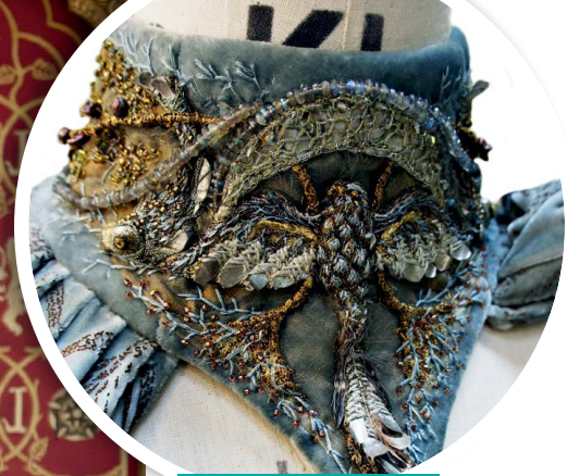
Un col fait pour un costume de Lysa Arryn.

Non seulement c'est un défi de créer toutes ces broderies en peu de temps — comme c'est toujours le cas quand on travaille pour la télé —, mais ça peut être épuisant. Je reste assise à ma table de couture pendant de longues journées, ayant à peine le temps de me lever pour boire une tasse de thé. Je n'ai pas d'assistant: je travaille seule et j'accomplis souvent des tâches répétitives.