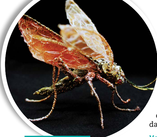
Un insecte de Qarth.

l'an prochain j'aurai de nouvelles broderies favorites, mais j'en doute. Je ne suis jamais tout à fait satisfaite de ce que je viens de terminer: je pense toujours à ce que j'aurais pu mieux faire si j'avais eu plus de temps. Je suis continuellement en quête d'amélioration.