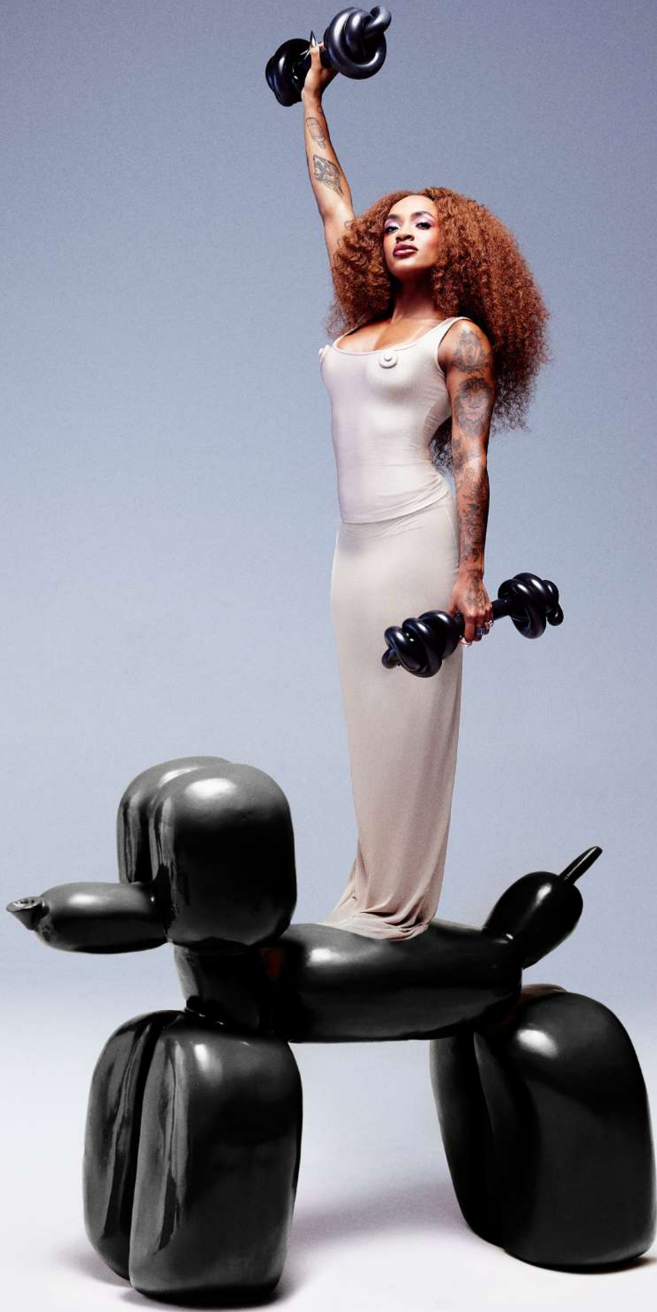
Patrícia veste top, Hand Lace , vestido usado como saia, Fauve , Brinco, Betty Brand , anéis, Guels