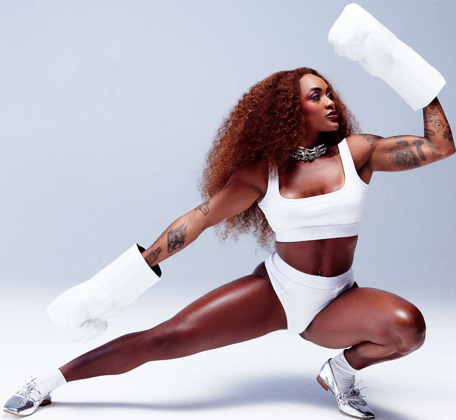
Top e hot pants, ambos Francesca . Brinco, Betty Brand ; colar (corpo), Paola Vilas ; colar, Crayons ; meias, Calzedonia . Sapatilha, Pége