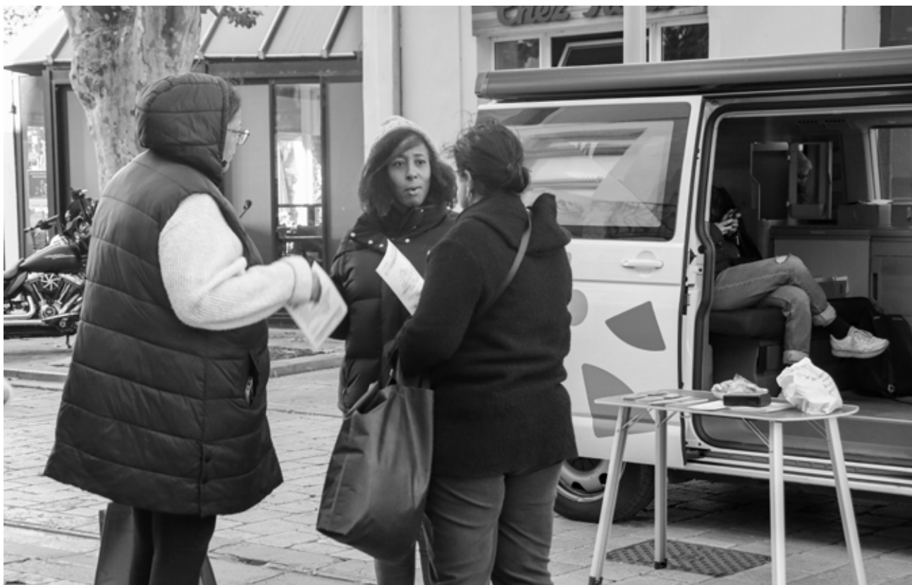
▲ Le véhicule intervient aussi bien dans les établissements scolaires que sur les marchés de village, les bureaux de poste, les festivals ou les événements sportifs.