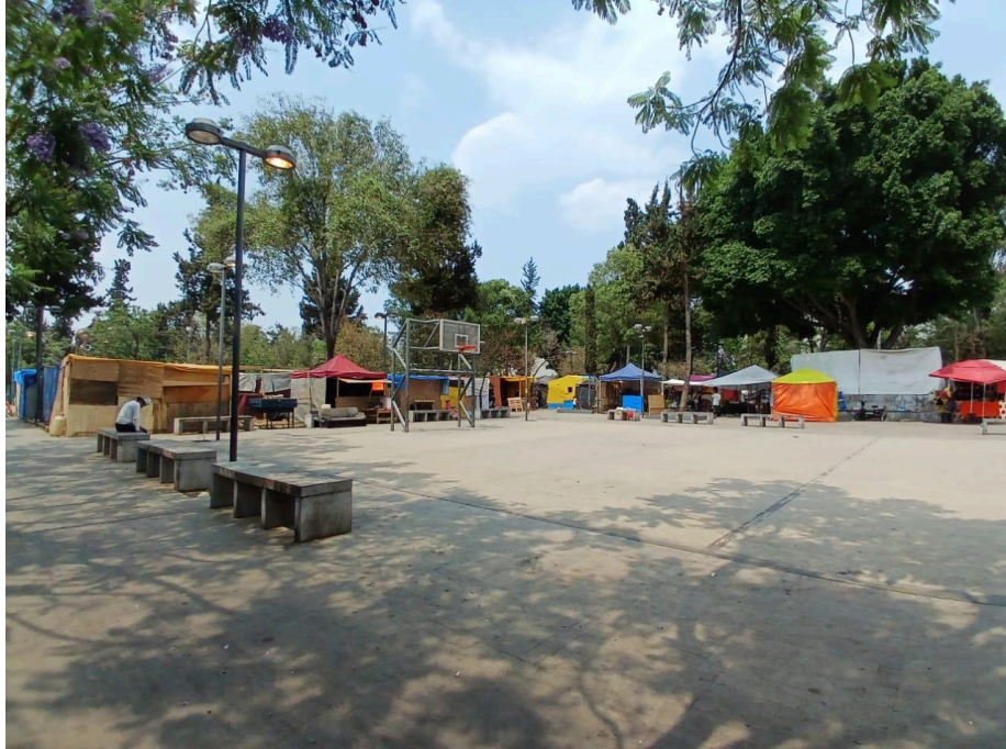
Vista panorámica del campamento migrante en el Parque Guadalupe Victoria, Venustiano Carranza, CDMX.