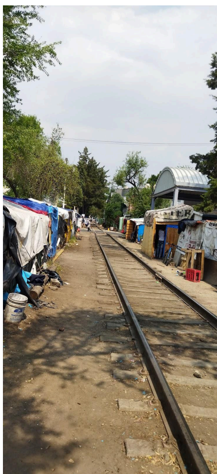
El campamento de migrantes en Vallejo se encuentra en medio de las vías del tren.