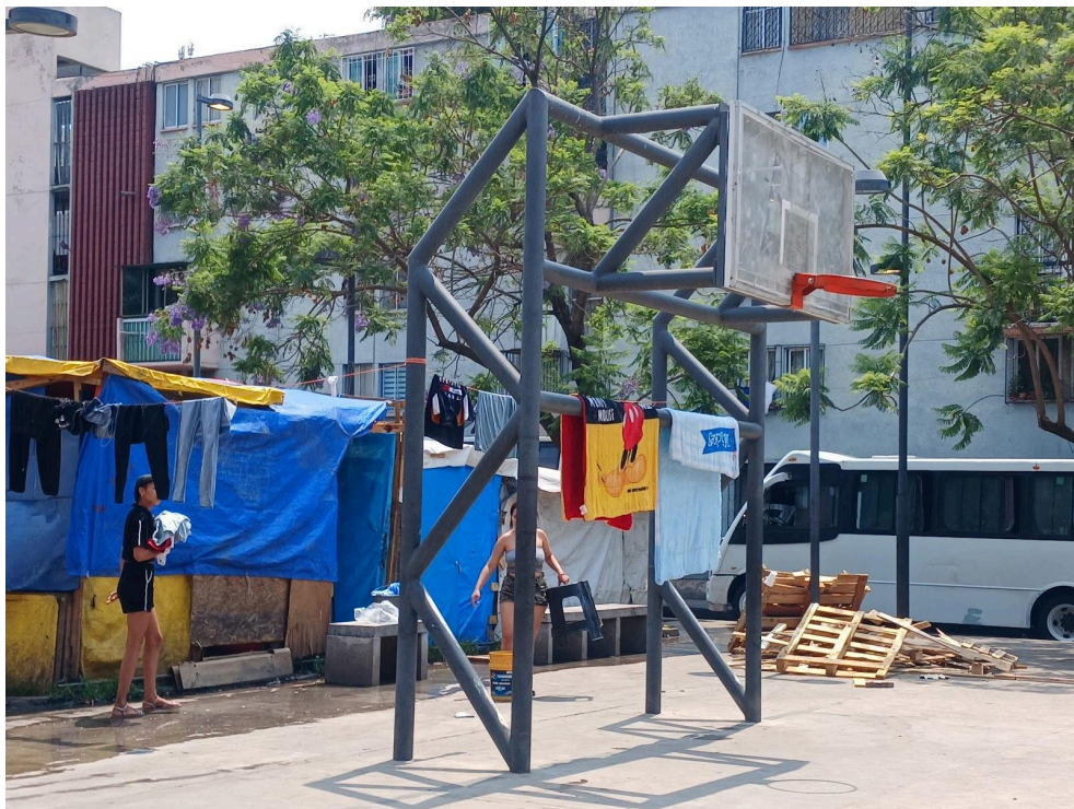
Mujeres secan la ropa recién lavada en el Parque Guadalupe Victoria, Venustiano Carranza, CDMX.

Los pequeños que migran son partícipes de una situación sobre la que no tienen control. La empatía y el trato digno hacia ellos es un deber, ya no solo institucional, sino moral y ético, comunitario y personal.