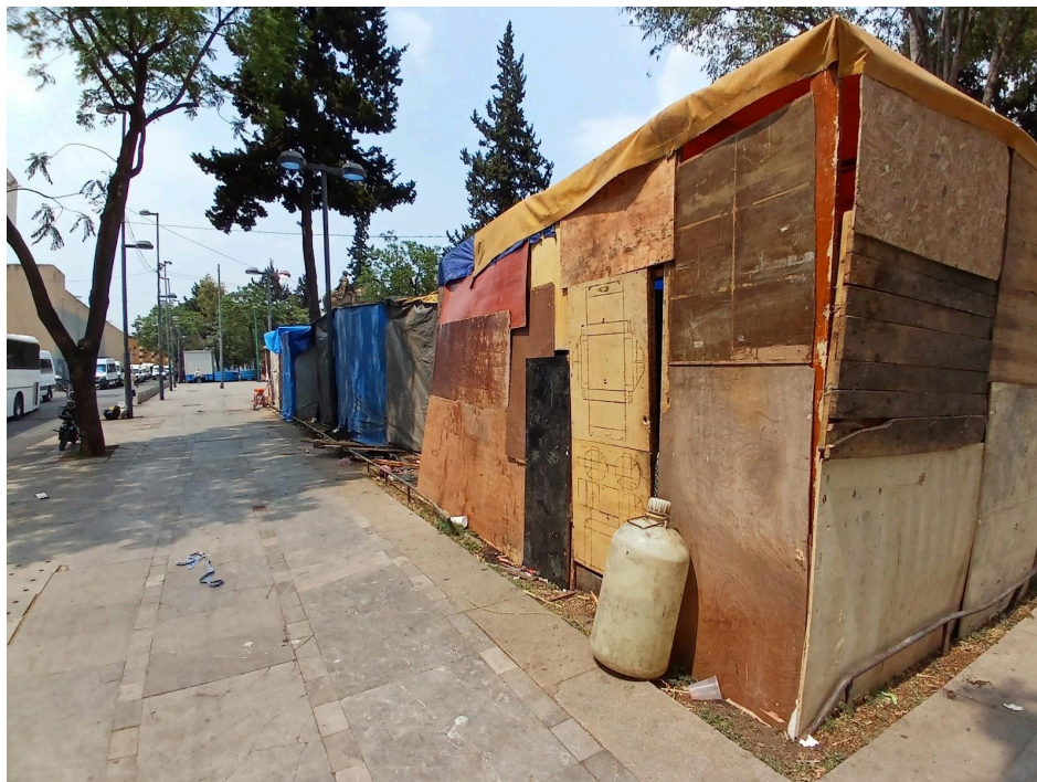
Casas improvisadas con retazos de madera en el campamento migrante ubicado en Candelaria de los Patos.