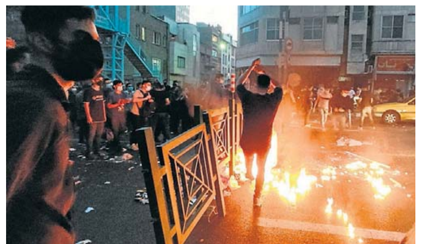
Protestes a la capital de l'Iran, Teheran, abans-d'ahir.

El president iranià va compareixer dimecres a l'Assemblea General de l'ONU, on va criticar que el món sigui hipòcrita a l'hora de parlar dels drets humans i va lamentar que molts governs jutgin l'Iran amb una mirada esbiaixada. —