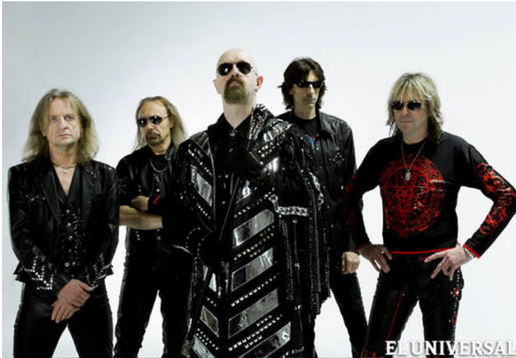
Judas Priest se presentará junto con Whitesnake por primera vez en Venezuela el 25 de septiembre en la Terraza del CCCT en Caracas

"Aunque ("Epitaph") es una gira de despedida, no es el final de Judas Priest, vamos a seguir juntos"