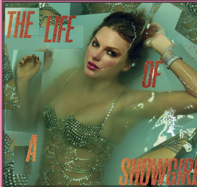
The Life of a Showgirl , le 12 e album de Taylor Swift, est déjà un phénomène mondial.

La tournée mondiale qui accompagne l'album, Eras Tour, s'achève sur des chiffres impressionnants : 149 concerts sur cinq continents, et un record de revenus qui fait d'elle la tournée la plus lucrative de l'histoire de la pop. Chaque concert est un événement en soi, combinant des performances visuelles