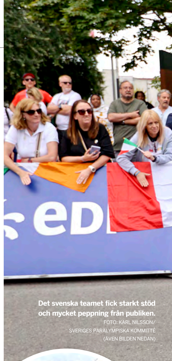
Det svenska teamet fick starkt stöd och mycket peppning från publiken.

För visst är det något speciellt med OS och Paralympics. Att röra sig i den