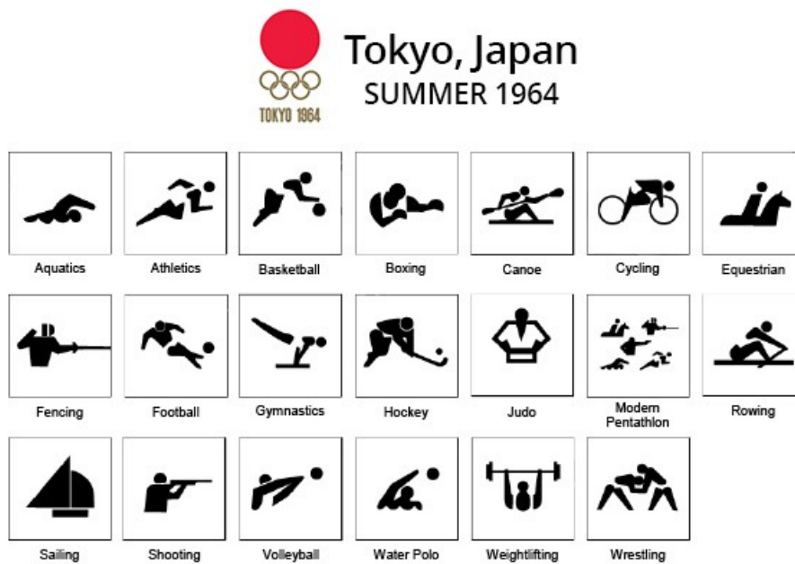
Pictogramas e logotipo de Tóquio-1964