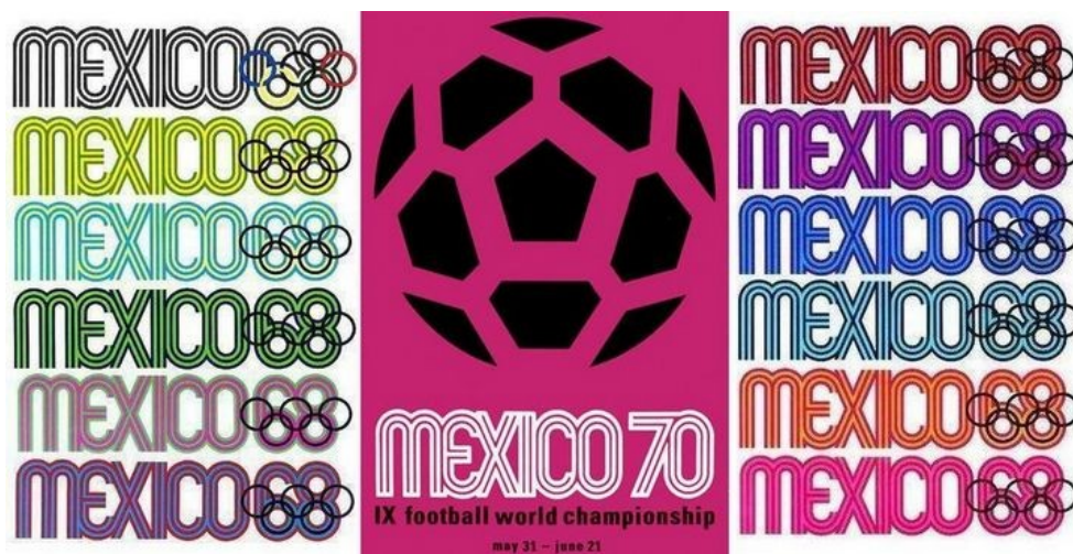
Logotipos de Cidade do México-1968 e México-1970

Em meio ao crescimento do interesse de toda a população mundial nos eventos esportivos, que também iam justificando a alcunha adotada neste trabalho – “megaeventos” – a cobertura midiática dos mesmos também se expandia proporcionalmente. E em meio à realização dos Jogos Olímpicos de Verão de Munique-1972, a imprensa mundial cobriu um fato externo e ao mesmo tempo interno às competições, não nos estádios ou ginásios, mas sim na vila olímpica: o “Massacre de Munique”. Cinco anos antes, em 1967, Israel desrespeitou as fronteiras delimitadas pela ONU em 1948 que determinavam os limites para a formação dos estados israelense e palestino, invadindo a Faixa de Gaza, a Cisjordânia e Jerusalém Oriental. Mas não apenas isso: tomou, respectivamente,