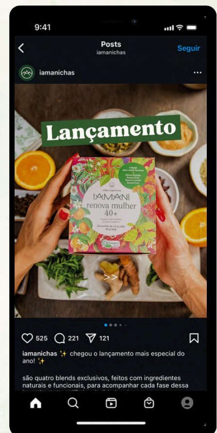
@Ver post original no Instagram

As mensagens foram desenvolvidas em alinhamento com a identidade serena e consciente da IAMANÍ, respeitando o ritmo do público e a essência do produto.