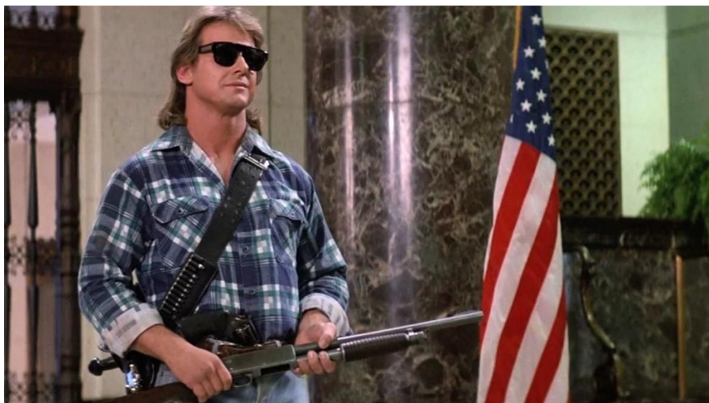
Roddy Piper é "Jhon Nada" nessa 'quase' ficção de 1989

história. Com eles, Nada enxerga o invisível: outdoors que ordenam “ Compre ”, “ Obedeça ”, “ Não questione ”, e rostos humanos que se revelam como criaturas alienígenas — elites disfarçadas que dominam o planeta sem levantar suspeitas.