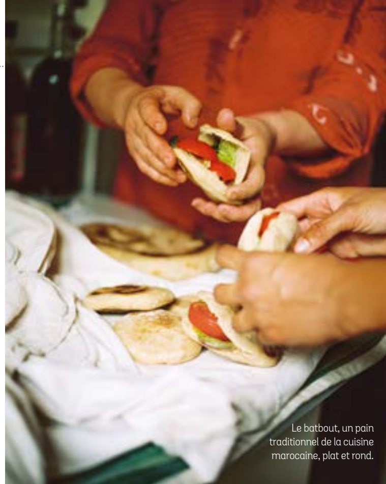
Le batbout, un pain traditionnel de la cuisine marocaine, plat et rond.