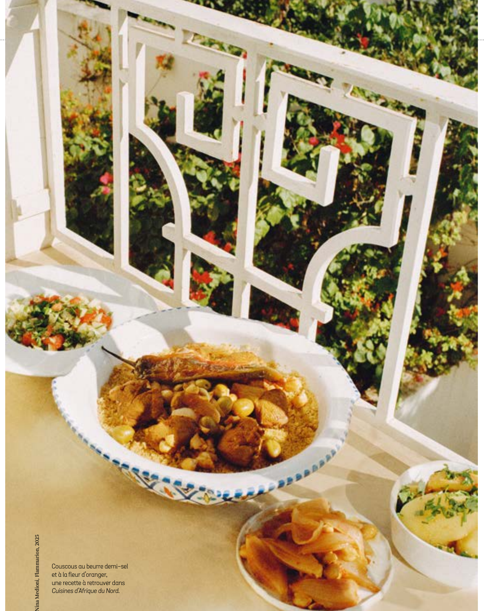
Couscous au beurre demi-sel et à la fleur d'oranger, une recette à retrouver dans Cuisines d'Afrique du Nord.