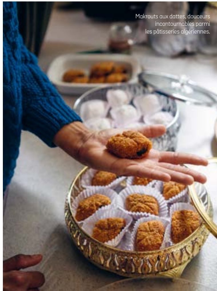
Makrouts aux dattes, douceurs incontournables parmi les pâtisseries algériennes.