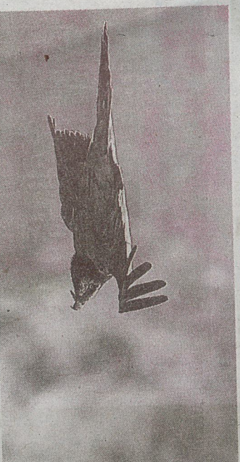
Le gypaète barbu, perle rare des causses.

Et de conclure : « C'est dommage, ça devait être le salon du bonheur. »