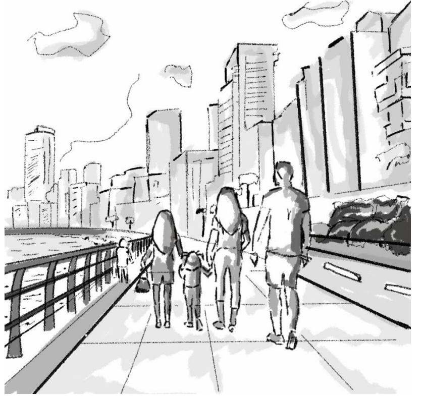
تذهب العائلة الى الروشة للنزه بعض الوقت