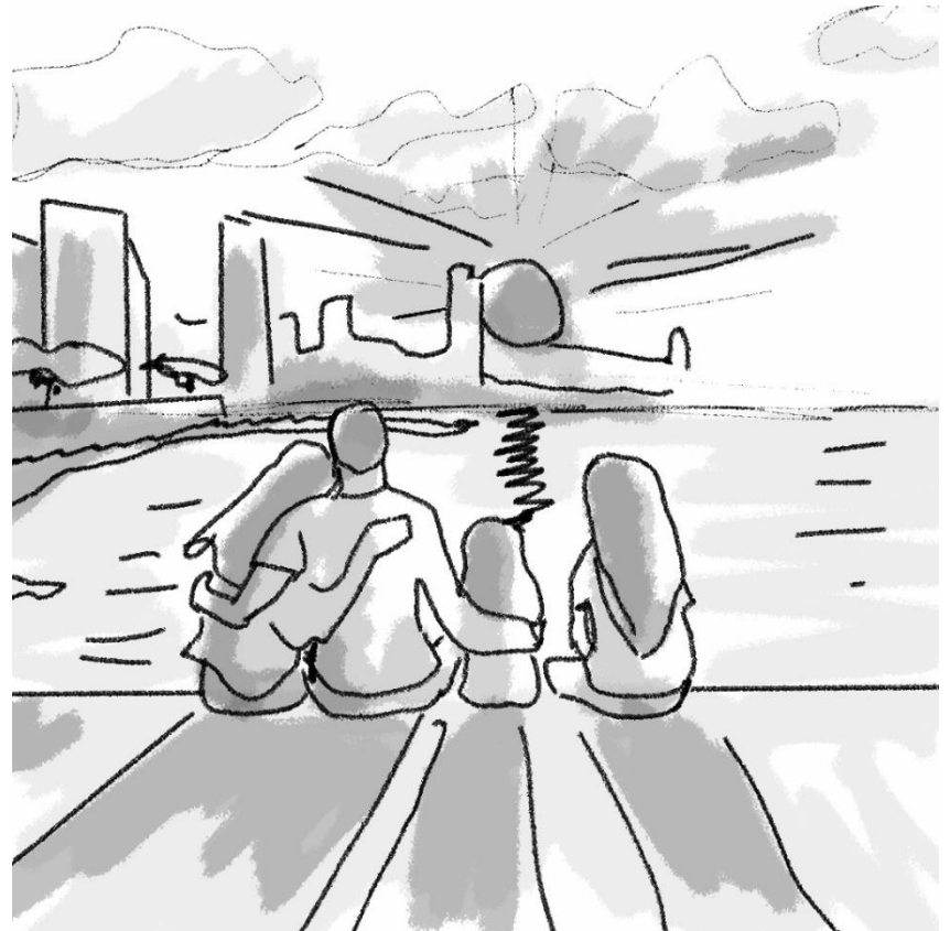
تشاهد العائلة غروب الشمس بهدوء و حب و تراقب لمعة اشعة الشمس على المياه