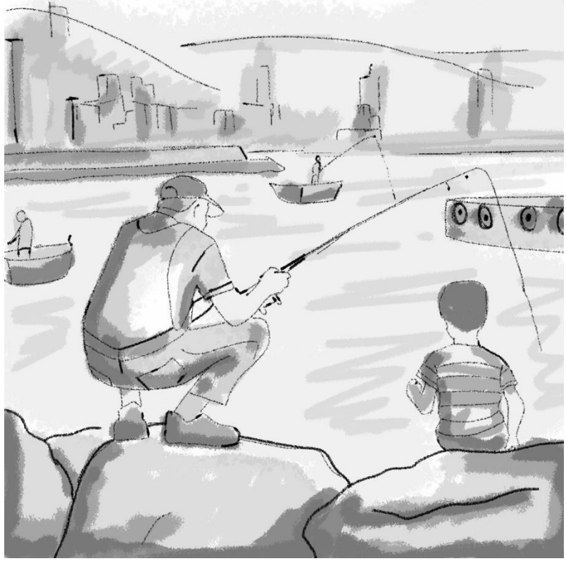
يظهر الاب عندما كان صغيراً و هو يمضي الوقت برفقت ابيه