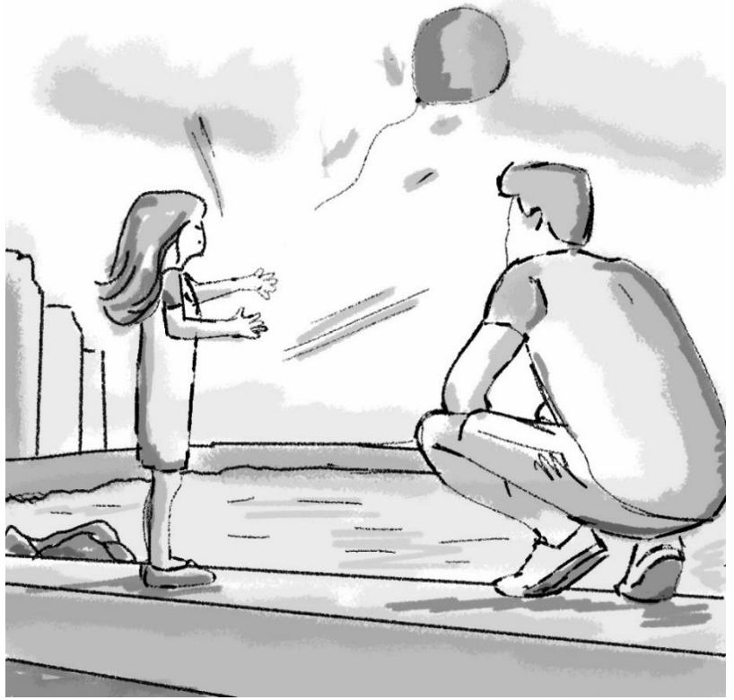
فجاءة يفلت البالون من البنت و تحزن