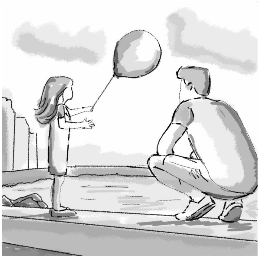
ترجع الى الوقت الحالي حيث يلاعب الاب ابنته و يمضي الوقت معها ويلاعبها بالبالون