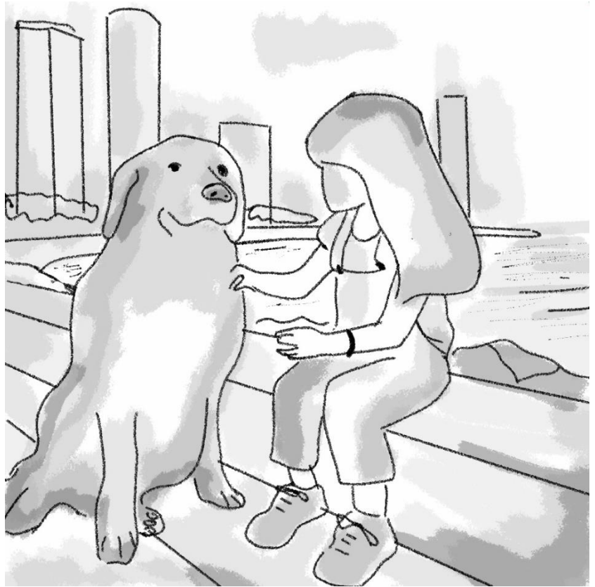
تفرح البنت الصغيرة عندما ترى الكلب و تلعب معه و تنسى البالون