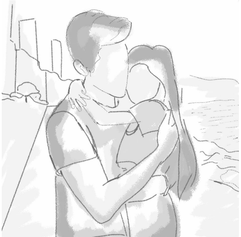
يحصن الاب ابنته بحنان و يطمئنها