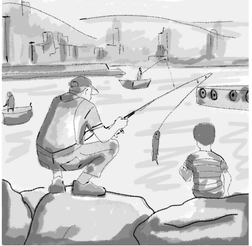
يصاد الاب سمكة