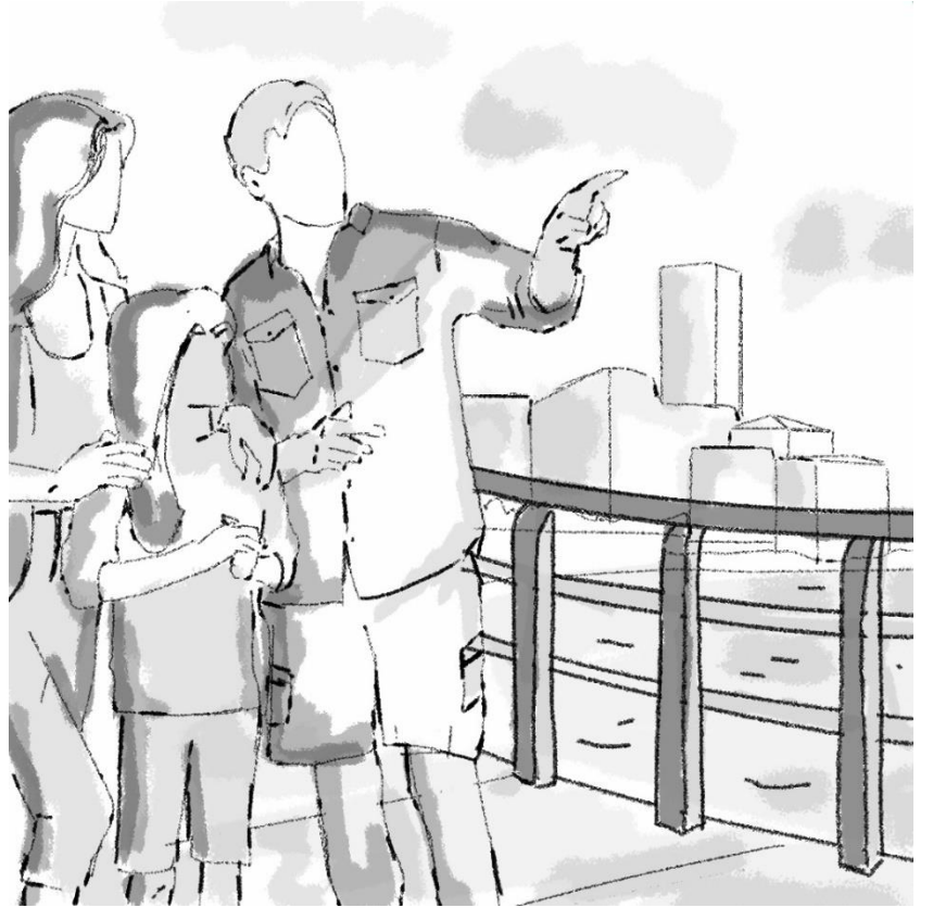
يشير الاب الى صياد سمك و يحدث عائلته و يحدث العائلة عن زكرياته مع ابوه