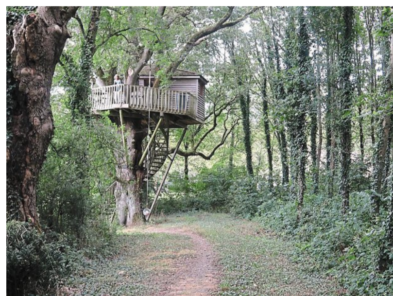
Un peu reculée dans les bois, l'une des deux cabanes louées par Aglaé de Beauregard agit comme un lieu de dépaysement le temps d'un soir ou d'un week-end.