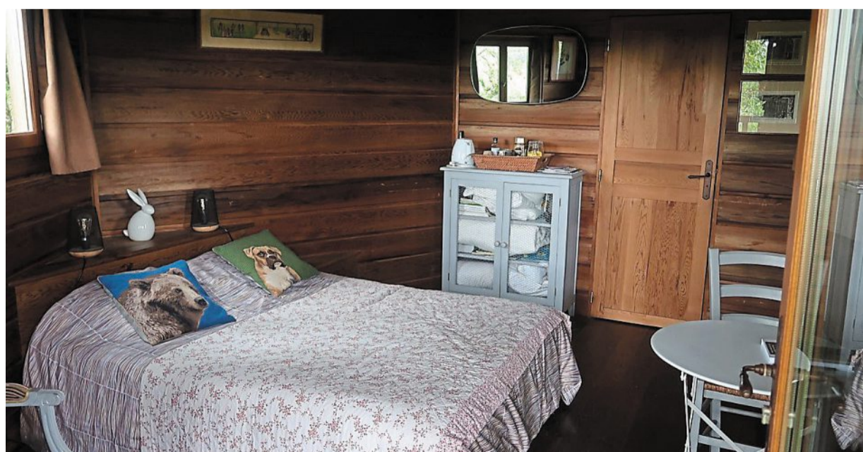
À l'intérieur, seuls un lit et quelques armoires peuvent tenir. Au fond, une porte donne sur une salle de bains spartiate composée de toilettes sèches et d'un petit réservoir d'eau.