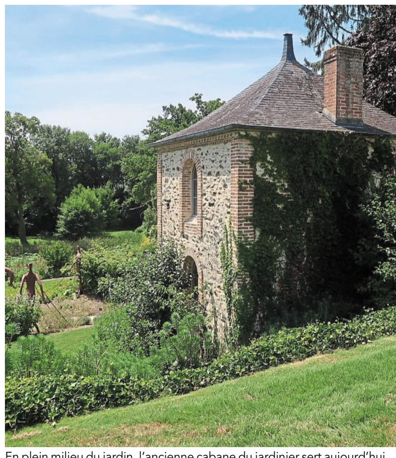
En plein milieu du jardin, l'ancienne cabane du jardinier sert aujourd'hui de droguerie et de lieu d'exposition des diverses plantes.