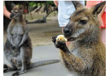
Un wallaby de Bennett de La Possonnière.