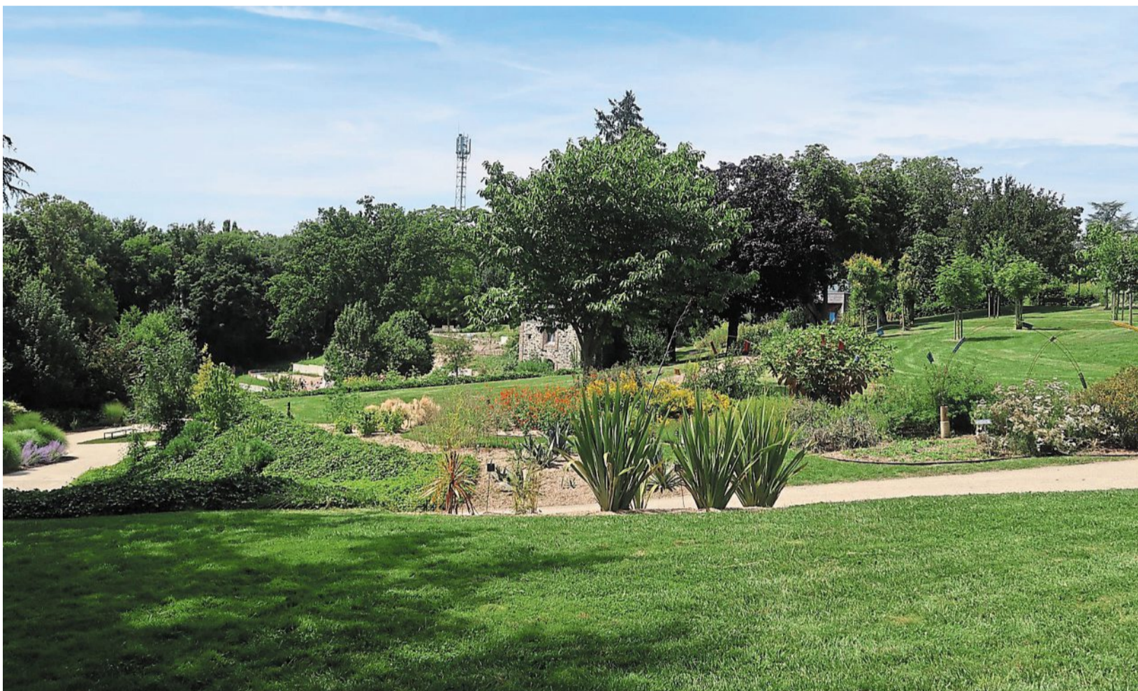
Chemillé-en-Anjou, jeudi 25 juillet. Situé dans le cœur des Mauges, le jardin Camifolia est un havre botanique dans la ville.

Un zoom est également fait sur la filière de production des Mauges, une véritable institution locale. « À Chemillé, il y a plus de 1 000 hectares qui sont utilisés par cette filière de production », poursuit le quadragénaire. « Ne serait-ce que pour la production de la camomille à fleur double, emblème du parc, Chemillé produit les trois quarts de la production française. » Le lieu se veut aussi pédagogique, à la fois sur le jardin, la production des plantes ainsi que sur leur récolte. « On a réaménagé la cabane du botaniste pour en faire une droguerie où l'on a installé les plantes raménées par Pierre-Aimé Godillon de son