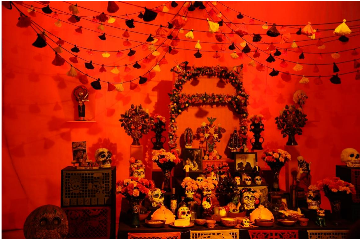
Altar representativo da celebração do Dia de Los Muertos - Foto: Isabela Rosenbaum Theodoro

O “Dia de Los Muertos” trata-se de uma data festiva católica, conhecida no México como o Dia dos Fiéis Defuntos e de Todos os Santos, realizada no dia 02 de novembro. As comemorações baseiam-se na crença popular de que os entes queridos merecem ser lembrados com alegria, já que para eles a morte é considerada um modo de libertação. Assim, por meio de cores vibrantes e músicas animadas, a tradição mexicana sobre a morte afasta a noção de tristeza observada nas demais culturas.