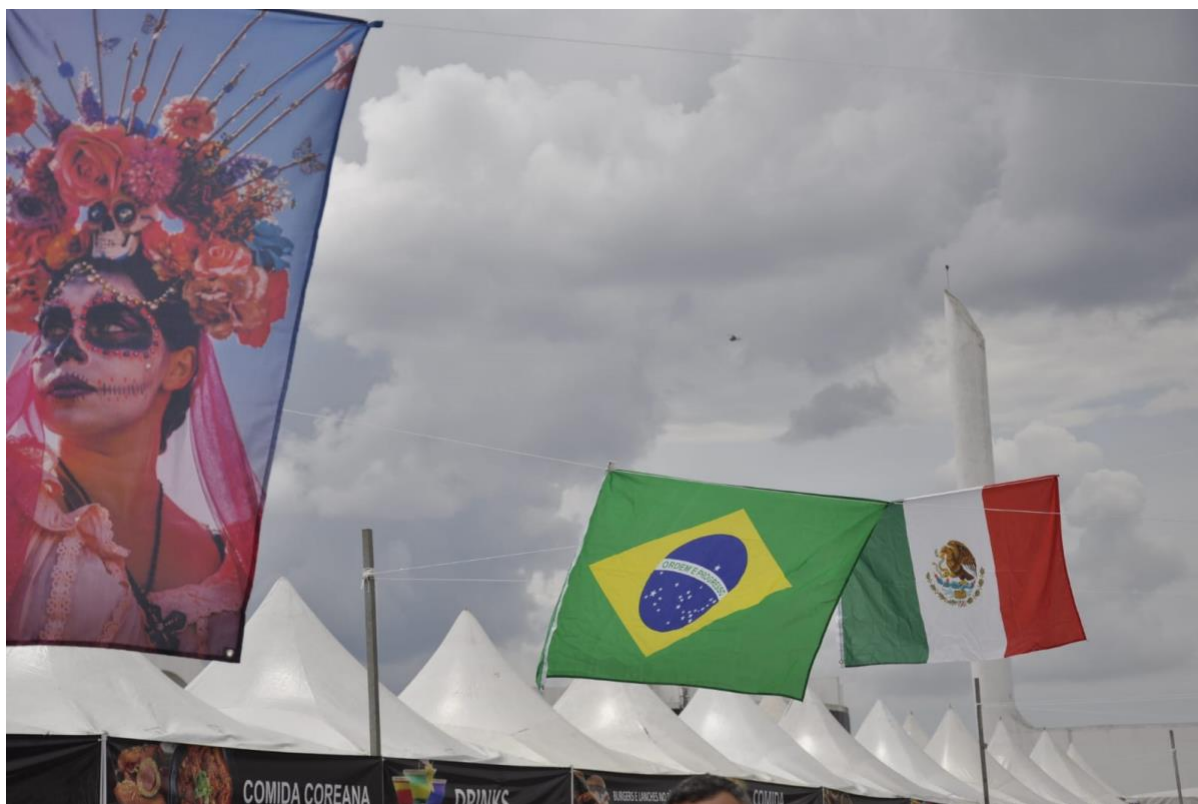
Bandeiras do Brasil e do México e barracas de alimentação, na Praça da Sombra

Contando com disposição de mais de 15 intervenções artísticas, o grande destaque do evento foram os altares para Frida Khalo e Tarsila do Amaral, disponíveis na Galeria Marta Traba. Além dessas figuras, as exposições dos altares também homenagearam artistas influentes, como o ator mexicano Roberto Gomez Bolaños, conhecido por interpretar o personagem Chaves, na série de mesmo nome.