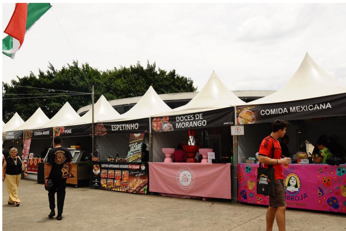
Barracas de comida mexicana e de demais países

Buscando entreter os visitantes de diferentes idades, o “Dia de Los Muertos” possuía tendas para a comercialização de artesanatos –que iam desde bolsas até bonecas de pano-, além de áreas para a realização de “flash tattoos”, mais conhecidas como tatuagens de rena.