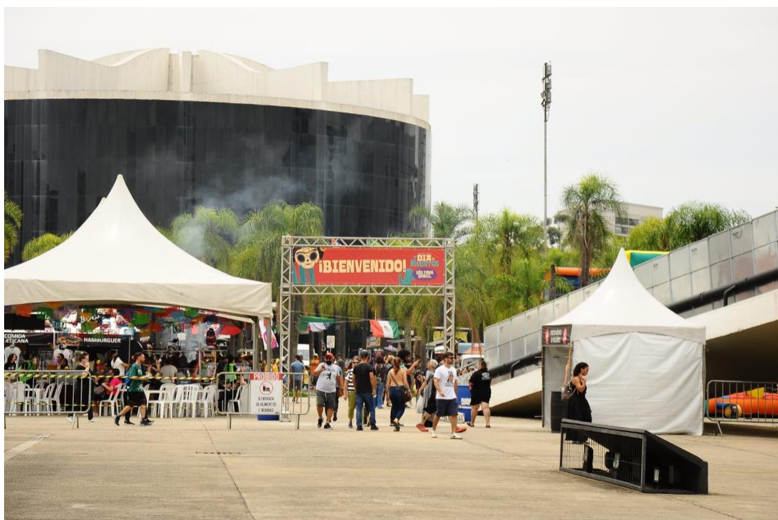
Entrada do evento, com acesso ao palco principal