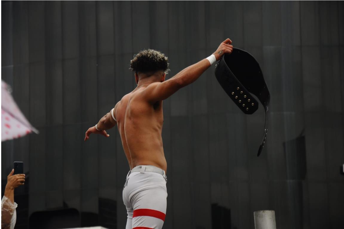
Vencedor da luta livre, segurando o cinturão da vitória

Um dos momentos mais aguardados pelos frequentadores do “Dia de Los Muertos” foi a apresentação artística dos alunos do colégio Albert Sabin. Performando a música "Cielito Lindo" e adequando-se à temática do filme "Viva! A Vida é uma Festa", o grupo de teatro do colégio dançou para o público em frente ao palco principal, na Praça Cívica.