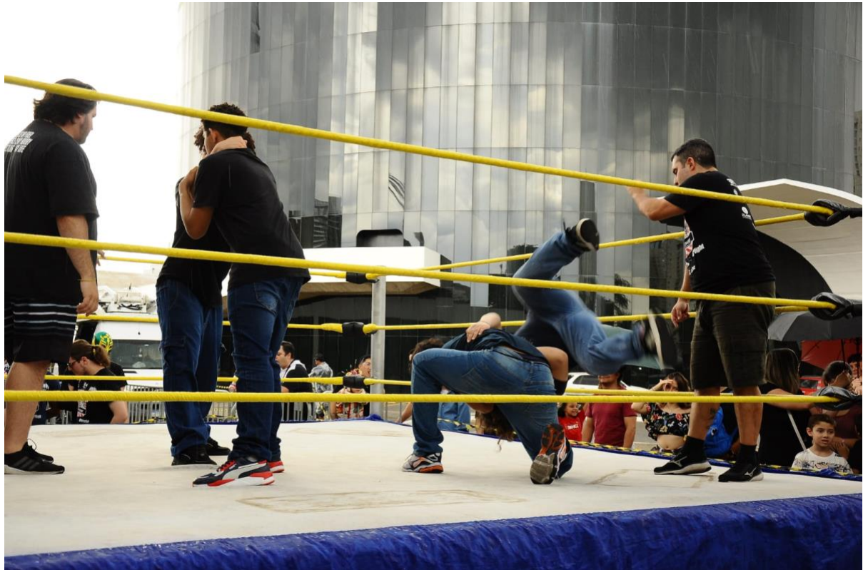
Oficina de luta livre, no ringue da Praça das Sombras

No evento, a luta livre atraiu principalmente crianças e adolescentes, por contar com diversos horários para as lutas, nos dois dias, além de realizar sessões de fotos com os lutadores.