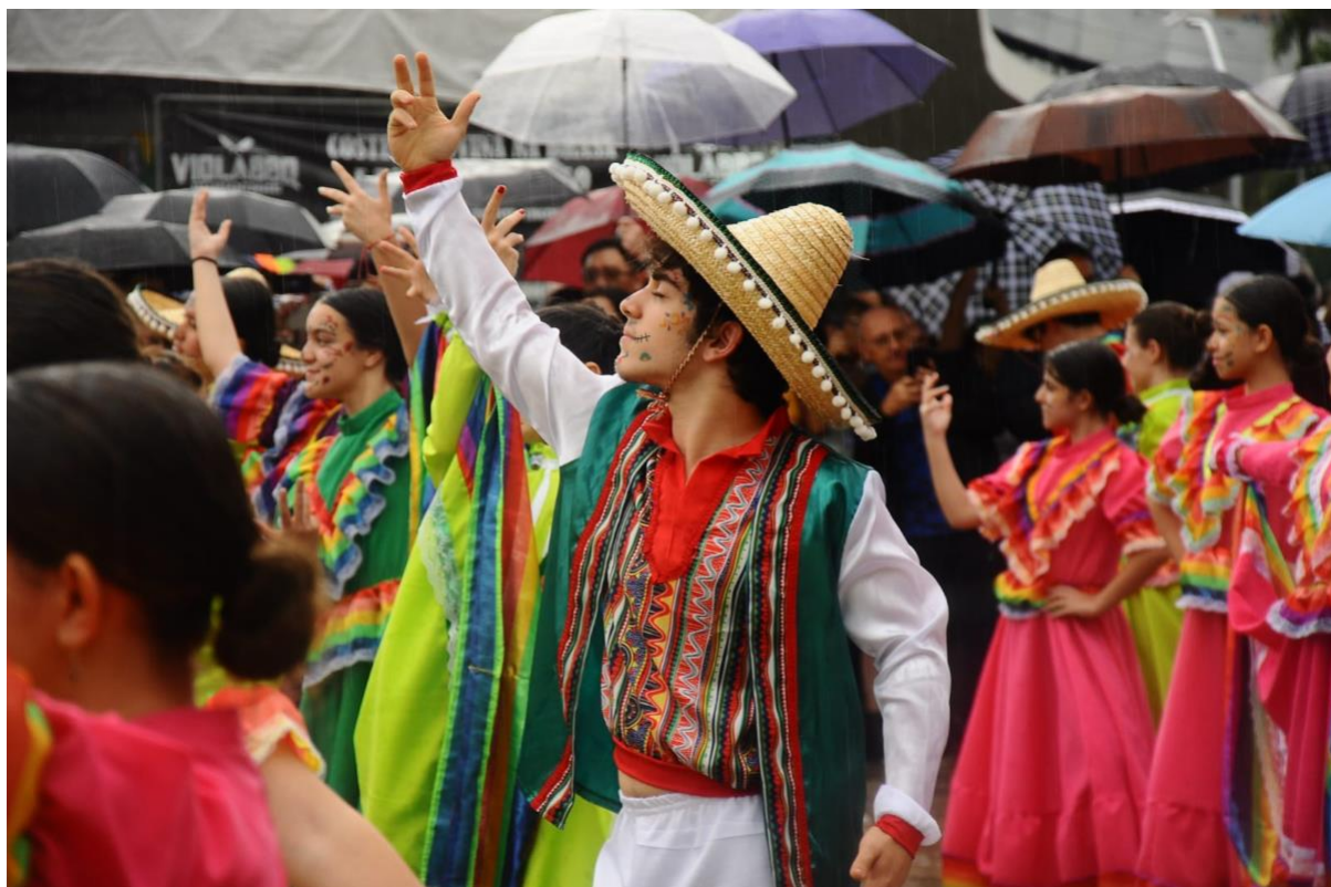
Dança típica mexicana, performada por alunos do colégio Albert Sabin