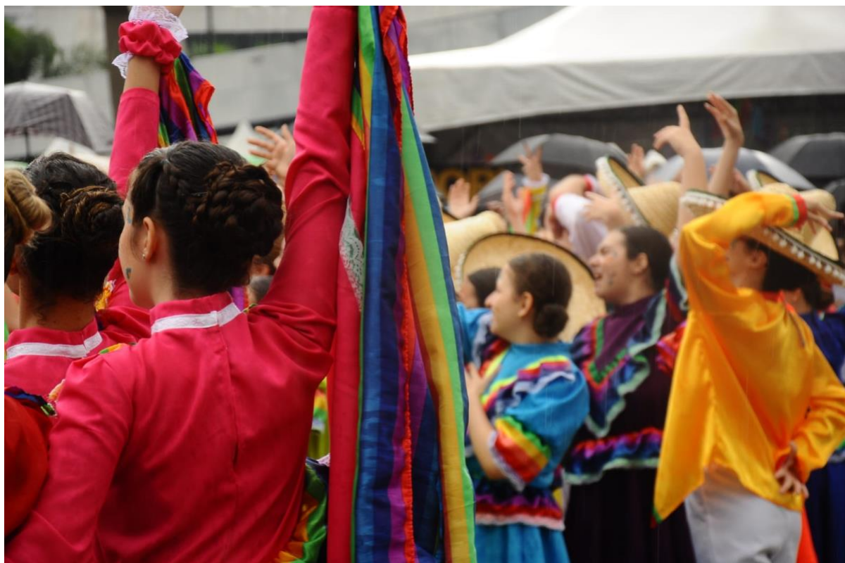
Alunos do colégio Albert Sabin em apresentação com a temática " Viva: a vida é uma festa", na Praça Cívica

Para remeterem às danças originárias do México, os alunos usaram roupas características dessa cultura, sempre com colorações vívidas e alegres. Os meninos vestiam camisas e calças, além do típico sombrero - chapéu de abas largas-, enquanto as meninas usavam o famoso rebozo – camisas largas e sem mangas- e saias longas que, por estarem presas aos seus pulsos, se movimentavam e rodavam durante a dança.