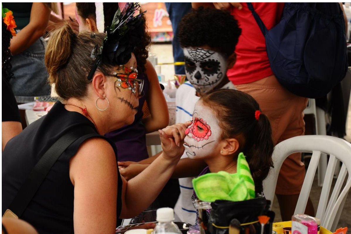
A barraca de pintura facial trazia diferentes maquiagens com a temática do dia dos mortos

Outra oficina que estimulou a integração do público com a festividade foi a de “lucha libre”, na qual as pessoas aprendiam os movimentos básicos para lutarem, como as acrobacias e golpes presentes nesse esporte.