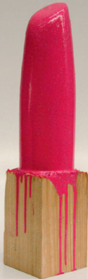
Skulptur „Rouge Beverly Hills“ von Vincent Olinet, oben. „B-52-statt Bomben“ von Wolf Vostell, rechts.