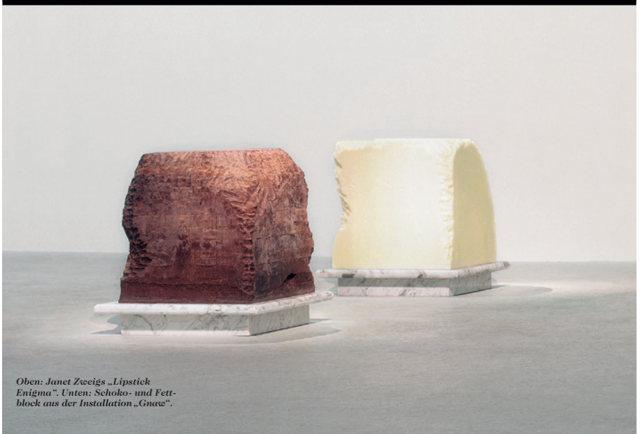
Oben: Janet Zweigs „Lipstick Enigma“. Unten: Schoko- und Fettblock aus der Installation „Guave“.