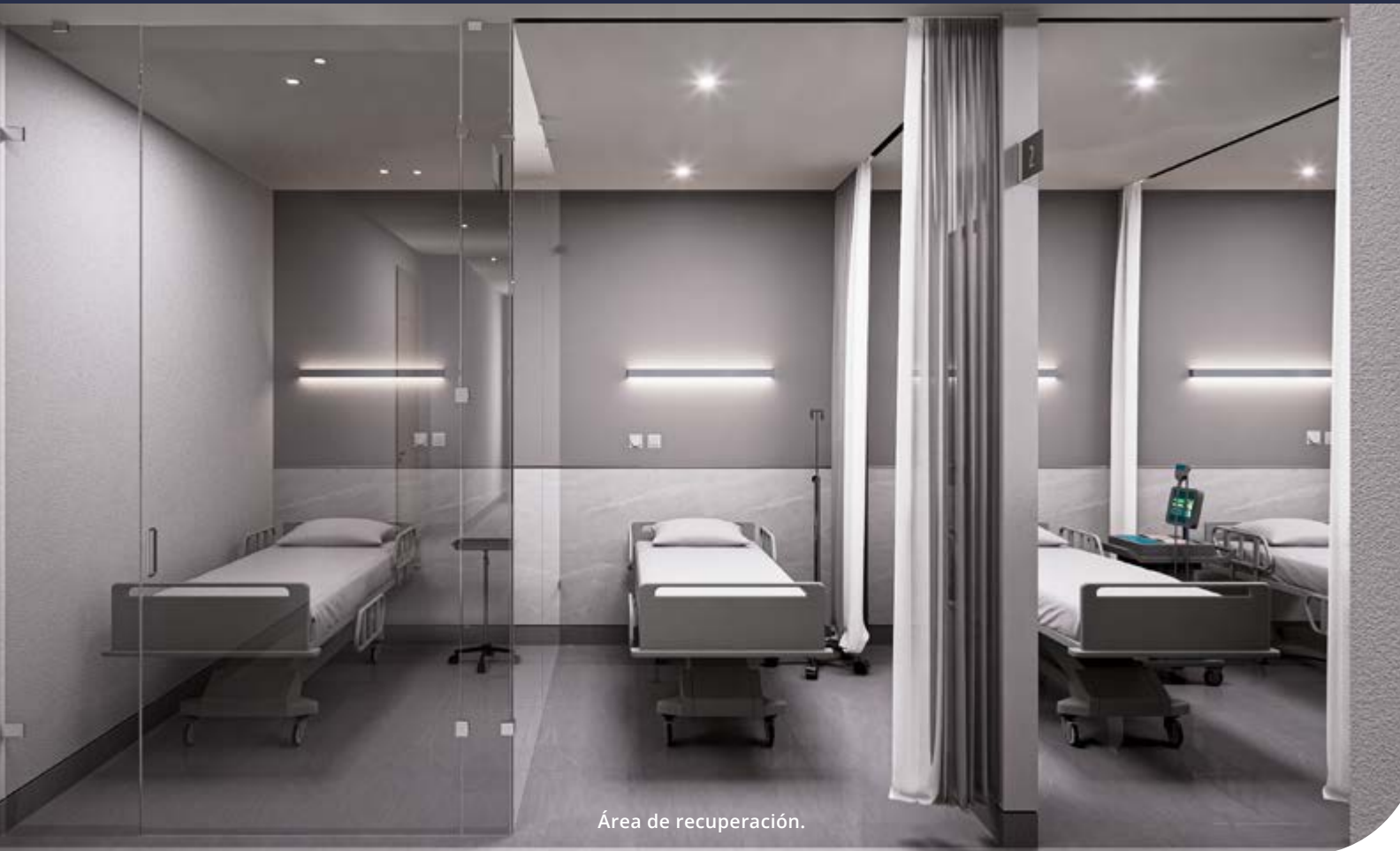
Área de recuperación.

ENALTA CUENTA CON INSTALACIONES QUIRÚRGICAS INTELIGENTES Y EQUIPOS DE ALTA GAMA. POR TANTO, LOS PROCESOS DE CADA PROCEDIMIENTO SIEMPRE CUIDARÁN LO MÁS IMPORTANTE: LA SALUD DEL PACIENTE.