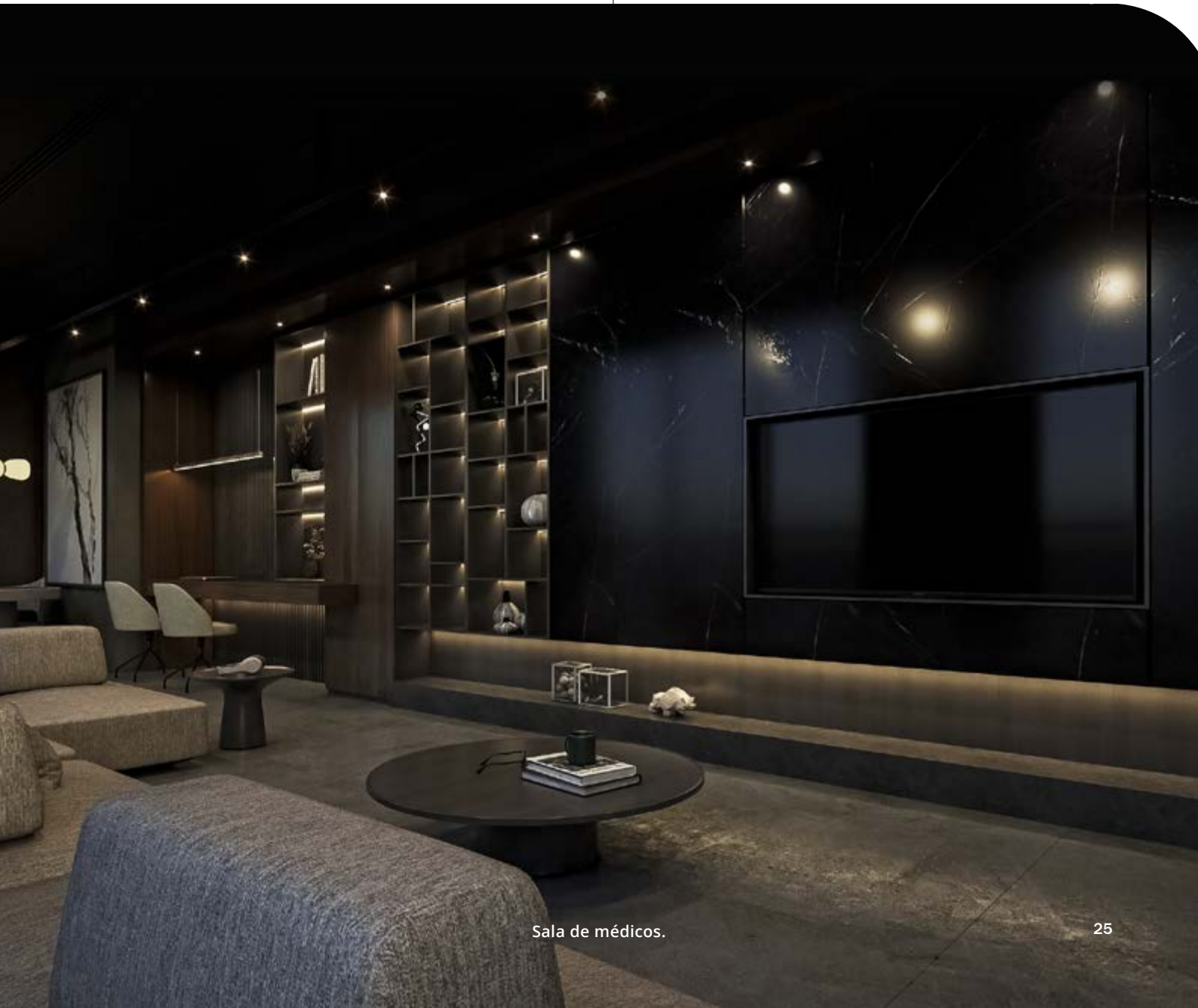
Sala de médicos.

Es decir, cada espacio en Enalta Medical Center ha sido cuidadosamente diseñado con lo mejor que existe en el mercado para proporcionar una excepcional experiencia en todos los aspectos.