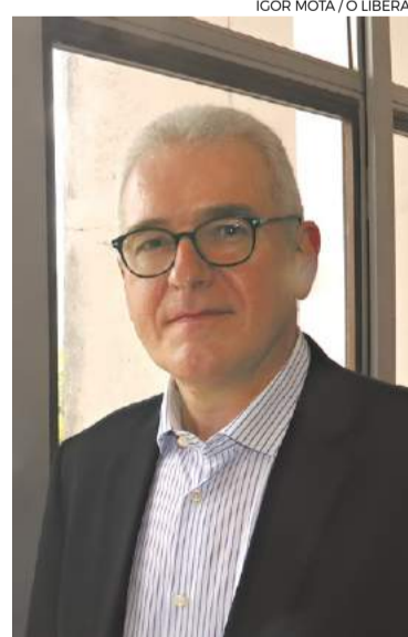
Reitor da UFPA,

Tourinho ressalta: “Temos uma grande capacidade científica instalada na região. Nossas universidades e institutos de pesquisas são competitivos internacionalmente, mas recebem poucos recursos e não realizam todo o seu potencial. Com o apoio devido, podemos criar condições para a conservação dos nossos recursos naturais e podemos desenvolver produtos de alto valor agregado. Com investimento em ciência e compromisso com as populações locais e com o meio ambiente, a Amazônia pode construir um novo e promissor ciclo de desenvolvimento”.