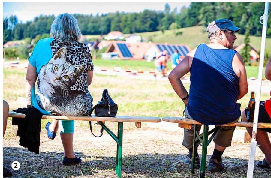
1 Die Schweizer Meisterschaft findet im Rahmen des Vereinsfests statt, das Jung und Alt anzieht. 2 Frauen finden sich hier fast nur unter den Zuschauern.