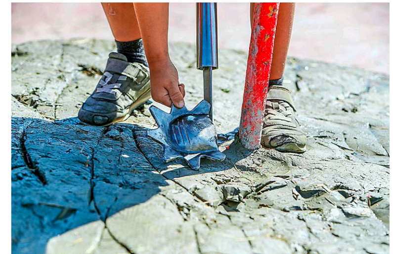
Bild links: Mit einem Messer wird die Kante der Platzge unter dem Lehm gesucht, mit dem Massband der Abstand gemessen. Rechts: Pro Zentimeter, mit dem die Platzge neben dem Eisenstock landet, gibts einen Punkt Abzug.

◀ unförmige, gezackte Metallring – die Platzge. Wie ein Kegler schwingt Schütz seinen Arm nach hinten und wieder zurück.