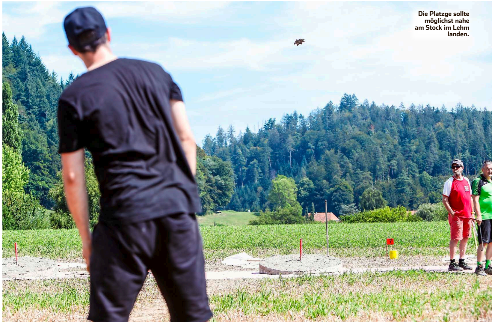
Die Platzge sollte möglichst nahe am Stock im Lehm landen.