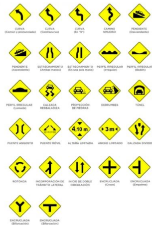
Señales de tránsito de prevención.