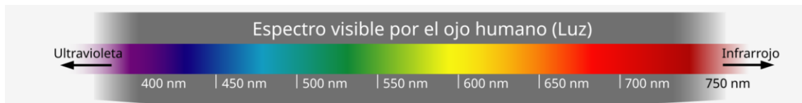
Visible spectrum for human eye.

Beyond the meaning, the immediacy of a certain type of sensation is striking. Its similarity to blood and fire can make us instinctively associate red with danger. However, its use is also attributed to the fact that it is the color that can be perceived from the greatest distance. The retina can encode the color red from 750 nanometers (one billionth of a meter). Therefore, it is useful for recognizing risks at a length that would be more complicated with other colors.