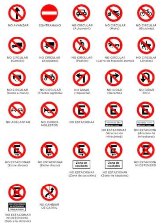
Señales de tránsito de prohibición.

Y es que muchas veces los colores pueden influenciar en nuestro estado de ánimo, a partir de las emociones que generan , sea por las conexiones cognitivas que estimulan o por simple convenio social. Resulta muy fácil, por ejemplo, asociar el color amarillo con la alerta, el rojo con la prohibición, y el amarillo con la alerta y el verde con cierto tipo de habilitación . Sí, como un semáforo, pero no sucede solo en esos casos.