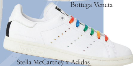
Stella McCartney x Adidas