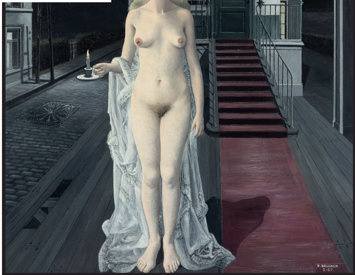
Paul Delvaux, Chrysis, 1967, olie op canvas, 160 x 140 cm. Collectie Stichting Paul Delvaux.