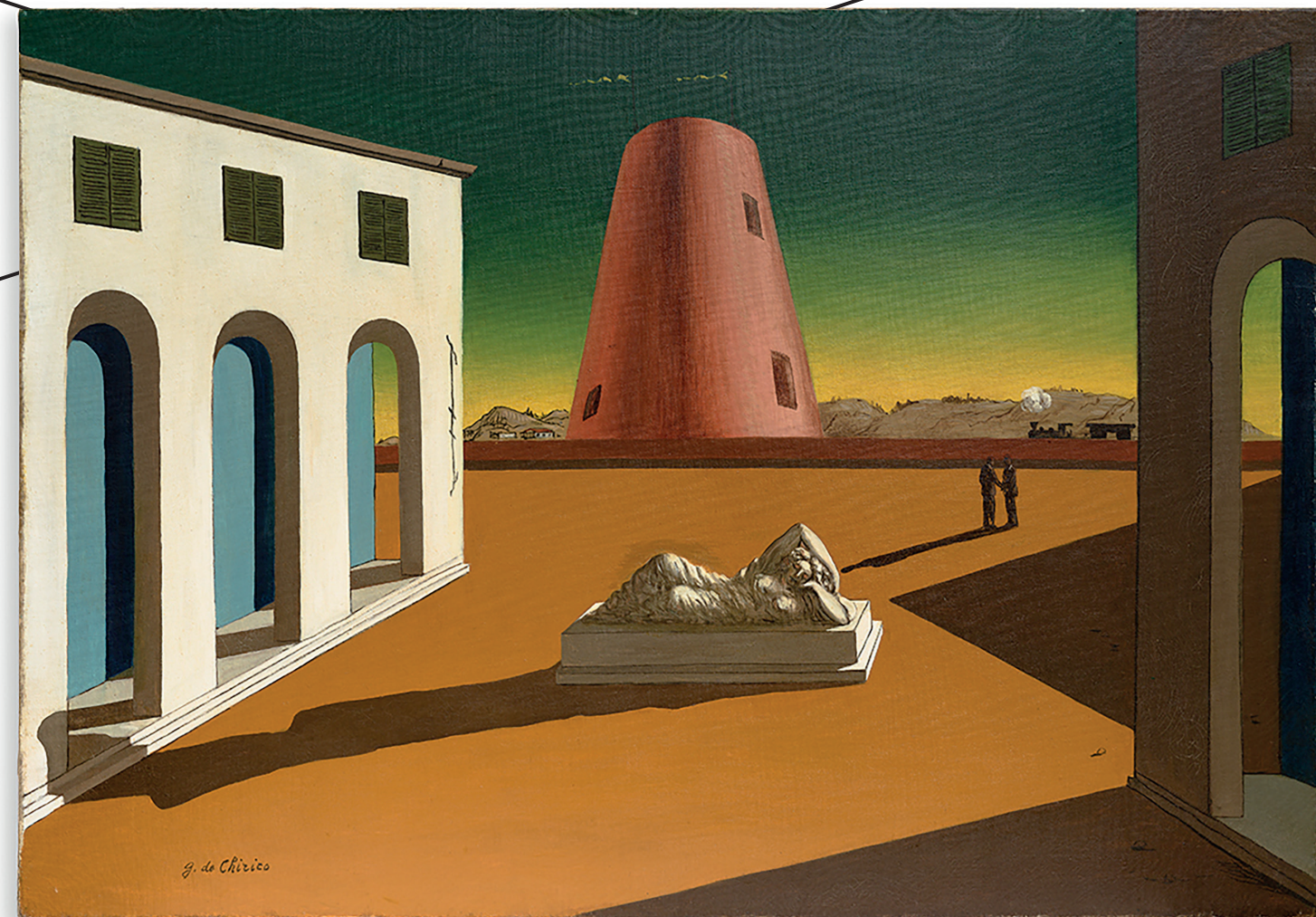
Giorgio de Chirico, Piazza d'Italia con Arimania , 1950, olie op canvas, 70 x 100 cm. Repetto Gallery.