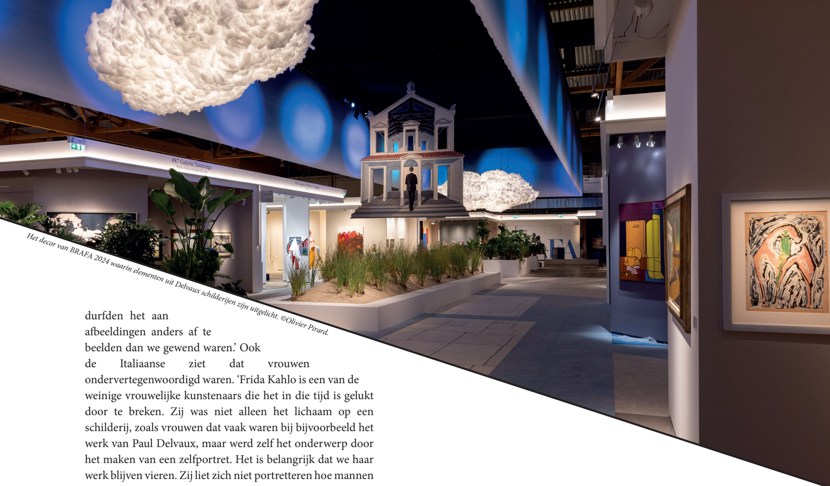
Het decor van BRAFA 2024 waarin elementen uit Delvaux schilderijen zijn uitgelicht.

durfden het aan afbeeldingen anders af te beelden dan we gewend waren.' Ook de Italiaanse ziet dat vrouwen ondervetegenwoordigd waren. 'Frida Kahlo is een van de weinige vrouwelijke kunstenaars die het in die tijd is gelukt door te breken. Zij was niet alleen het lichaam op een schilderij, zoals vrouwen dat vaak waren bij bijvoorbeeld het werk van Paul Delvaux, maar werd zelf het onderwerp door het maken van een zelfportret. Het is belangrijk dat we haar werk blijven viëren. Zij liet zich niet portretteren hoe mannen dat wilden, maar hoe ze dat zelf wilde.' Een feministe avant la lettre. Van Frida Kahlo is helaas geen werk te zien op BRAFA. Misschien omdat er weleens wordt gezegd dat Kahlo niet bij de stroming betrokken wilde zijn omdat het een te groot mannenbolwerk was.