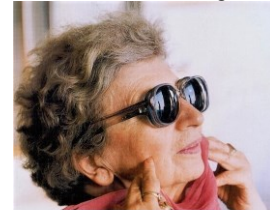
Annemarie Schimmel Morgenland und Abendland Mein west-östliches Leben C.H.Beck