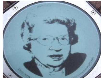
Schimmel Glasplatte Bonn