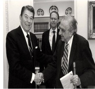
R. Reagan, E. Teller 1983

Alle Kriege, so 2022 bis 2024 um Israel und die Ukraine, tragen ihre Doktrinen und Lehren. Die Raketen- und Drohnen-Abwehr stehen heute dafür. Da Israel in Joint Air Defense mit Amerika und Partnern Angriffswellen aus dem Iran wirksam abwehrte, blicken viele in diese Geschichte integrierter Luftabwehren. Ich tat dies auch in deutschen, arabischen und US-Archiven, wo ich im Nachlass vom Ostberliner Regierungschef Walter Ulbricht (1893-1973) und von Präsident Ronald W. Reagan (1911-2004) fündig wurde. Ihm gab der Physiker Edward Teller einige Ideen (1908-2003, hier auf dem Bild beider 1983 rechts).