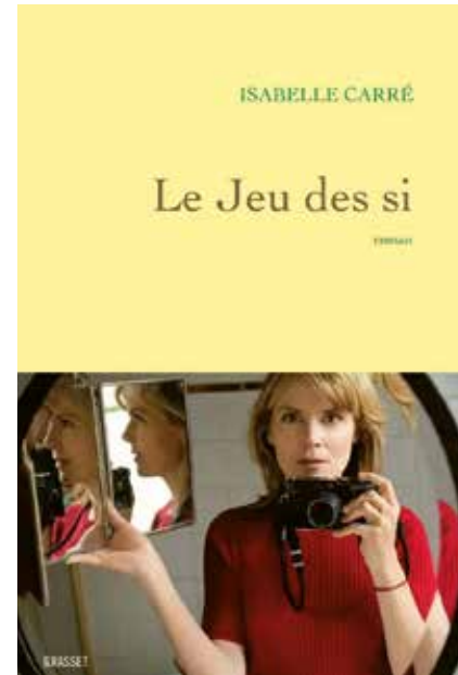
Le Jeu des si , Isabelle Carré, Grasset, mai 2022, May 2022

With her seemingly unassuming demeanor, actress Isabelle Carré has hidden her cards well for years. Not only does she captivate on the screen, but she also deeply moves through her writing. In 2018, she published her first book, a fictionalized account of her life, Les Rêveurs . The fold was made, success followed suit, and she continued her literary journey with Du côté des Indiens , in 2020. Since things happen in threes, the now established author releases a new novel of her own creation in 2022, Le Jeu des si . When Elisabeth (her protagonist) finds no one waiting for her at the airport, she decides to hop into the taxi of a certain Emma Auster, in an attempt to change her life. Layers of fiction multiply, creating a portrayal of a multifaceted woman. What if the actress within her served as her inspiration?