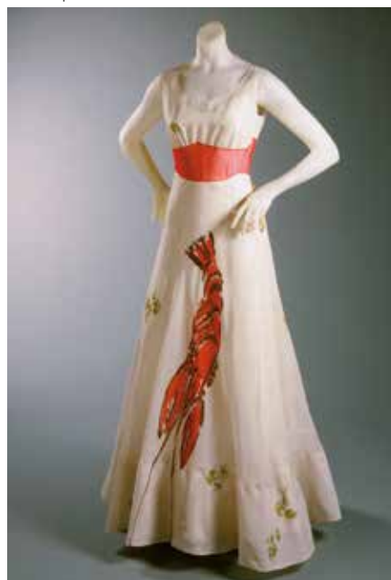
Elsa Schiaparelli en collaboration avec Salvador Dalí Robe du soir 1937 Soie

Bella Hadid sur une robe fourreau noire lors de l'édition 2021 du Festival de Cannes. Pour rendre ses créations uniques – telle la robe cage bijou en all-over de la collection printemps-été 2022 – le designer va même plus loin, en créant sa propre nuance d'or. Le métal, fondu dans un bain galvanique de la maison, reprend ainsi le patinage de l'ancien. On l'appelle désormais « l'or Schiaparelli ». La promesse d'une longévité légendaire.