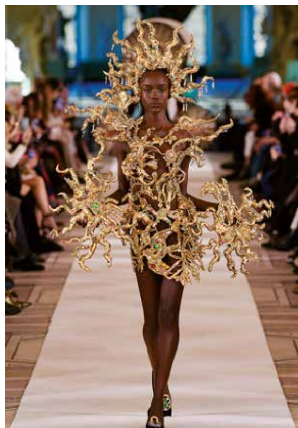
Une silhouette emblématique de la collection Haute Couture Printemps-Été 2022

Bella Hadid sur une robe fourreau noire lors de l'édition 2021 du Festival de Cannes. Pour rendre ses créations uniques – telle la robe cage bijou en all-over de la collection printemps-été 2022 – le designer va même plus loin, en créant sa propre nuance d'or. Le métal, fondu dans un bain galvanique de la maison, reprend ainsi le patinage de l'ancien. On l'appelle désormais « l'or Schiaparelli ». La promesse d'une longévité légendaire.