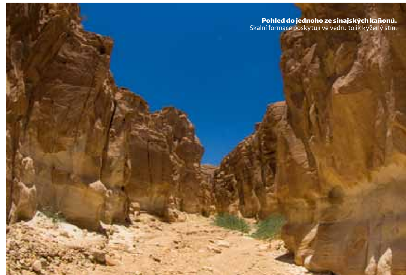
Pohled do jednoho ze sinajských kaňonů. Skalní formace poskytují ve vedru tolik kýžený stín.

Svou zemi znají po staletí a o svou kulturu se rádi podělí. Navíc jejich kuchyně je jednoduchá a velice chutná.