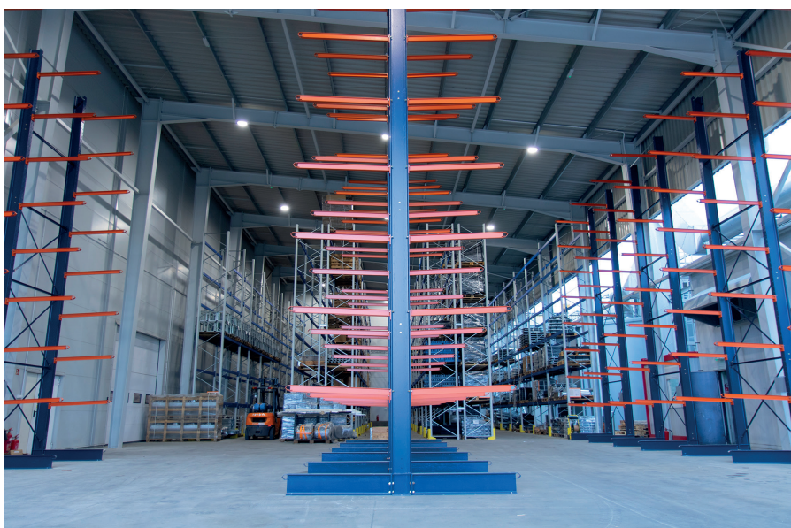
Oprócz szerokiej oferty wózków widłowych Promstahl oferuje regały oraz szeroki zakres urządzeń ułatwiających pracę magazynów. Ponadto zajmuje się sprzedażą ponad kilku tysięcy części zamiennych oraz usługami serwisowymi

PJP Makrum S.A. to Grupa Przemysłowa notowana na Giełdzie Papierów Wartościowych od 1999 r. Jej oferta stanowi remedium na wszystkie potrzeby branży magazynowej. Jej wyróżniającą cechą jest wykorzystywanie zachodzących w grupie synergii, dla pełniejszego i bardziej efektywnego zaspokajania potrzeb rynku i klienta. Grupa PJP Makrum wybuduje magazyn pod klucz, dostarczy kompleksowe systemy przeładunkowe, a także wyposaży obiekt w wózki widłowe, regały magazynowe i inne urządzenia wspomagające. ☞