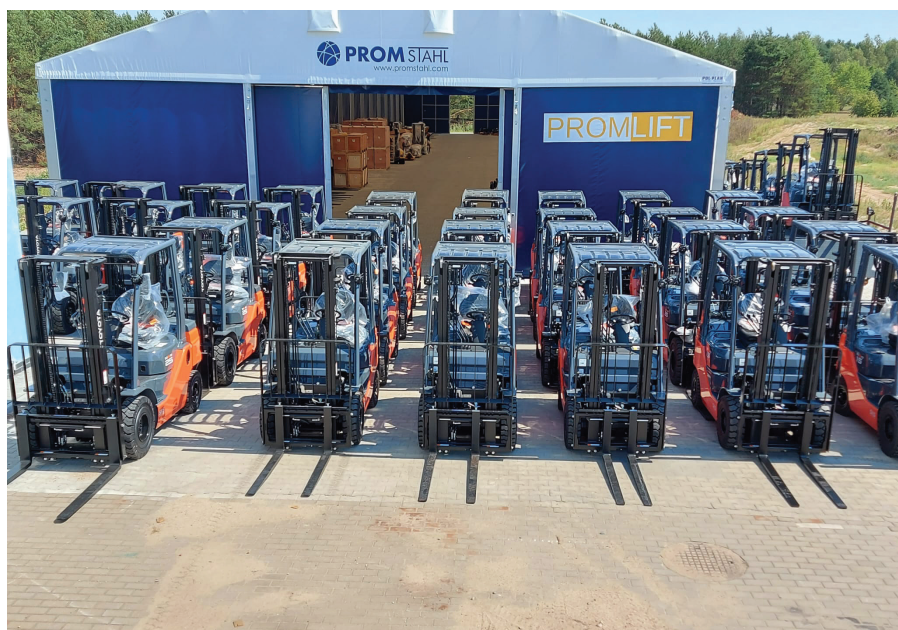
W ofercie Promstahl znaleźć można wózki uznanych światowych marek, takich jak Toyota, Jungheinrich czy Hangcha, dostępne od ręki

W ofercie Promstahl znaleźć można kilkanaście modeli nowych wózków paletowych, podnośnikowych i czołowych, a także inne urządzenia wspomagające transport ręczny w magazynie. Firma dostarcza nie tylko podstawowe wózki platformowe o niewielkim udźwigu, pozwalające np. na przewóz dokumentów i małych paczek, ale również zaawansowane podnośniki, stoły nożycowe lub wózki do transportu produktów specjalistycznych. Ponadto, zajmuje się sprzedażą ponad kilku tysięcy części zamiennych oraz usługami.