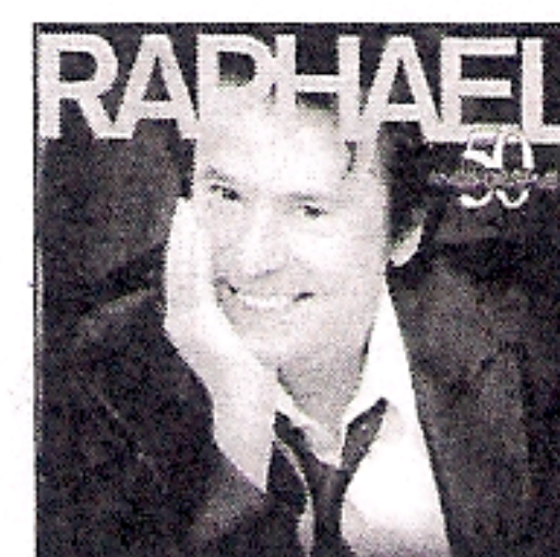
3 RAPHAEL '50 años después' SONY MUSIC