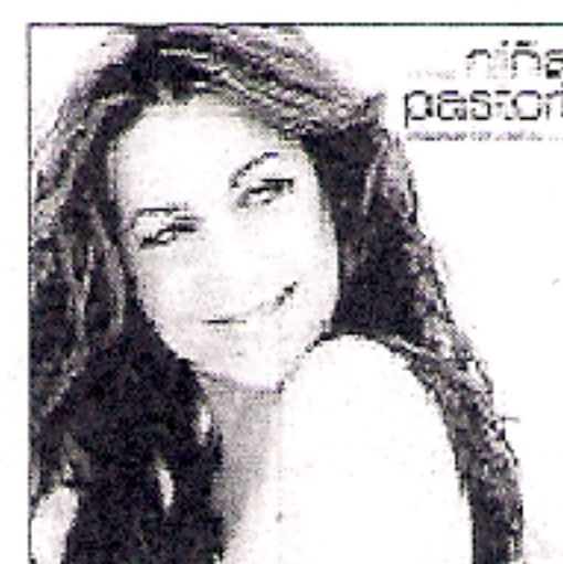
2 NIÑA PASTORI 'Esperando verte' SONY-BMG