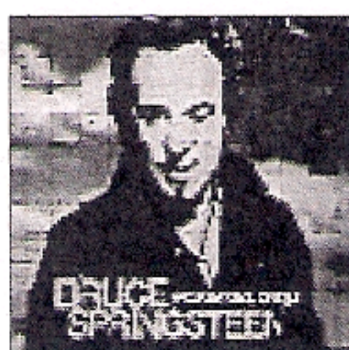
1 BRUCE SPRINGSTEEN 'Working on a dream' SONY-BMG