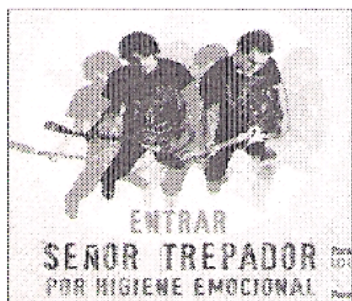
Carátula del disco.

SEVILLA ■ Lo que quiero, lo que soy es el primer sencillo de Por higiene emocional , el último trabajo discográfico de Señor Trepador con el que regresan a la escena musical. Un sencillo que relata una historia de amor, pero más allá, describe lo que ocurre cuando se depende de la persona que amas y luego todo termina.