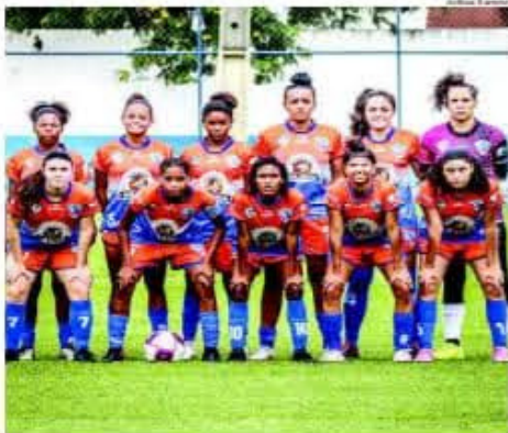
A equipe feminina do Duque de Caxias jogará a edição 2021 do Campeonato Carioca

Clube campeão da Copa do Brasil em 2010, competição precursora do Campeonato Brasileiro Feminino, a equipe da Baixada Fluminense disputou a Copa Libertadores da América em 2011, como uma das representantes brasileiras, na vaga de campeã nacional. Vale ressaltar que apenas em 2016, outra equipe do Estado ganhou um título nacional,