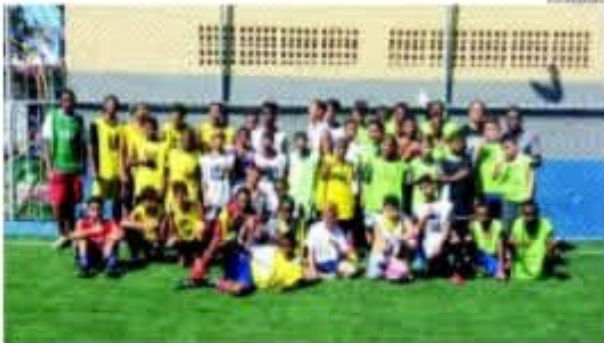
Os meninos do Renovação FC