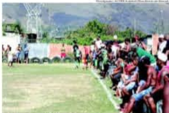
A bola continua rolando e agitando os campos de várzea da Baixada Fluminense

Já na sexta edição da Baixada Champions League (formato intermunicipal), houve sorteio no último dia 27 em uma casa de shows de São João de Meriti. A festa contou com a presença de jogadores, diretorias,