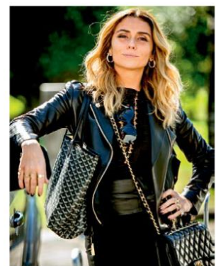
A REGRA DO JOGO (2015) Atena utiliza a cor Nada Básico, da Gio Antonelli para Colorama. “Uso o preto – que tem tudo a ver com a pegada rocker da Atena – e uma base fosca para criar esta unha geométrica.”