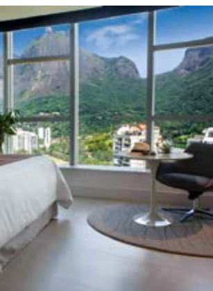
QUIOSQUE RIBA, NO LEBLON

O sucesso do bar na concorrida Dias Ferreira, no Leblon, se estendeu para a orla