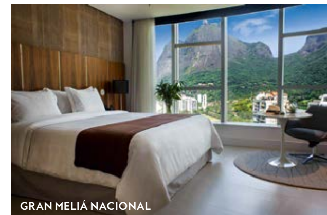
GRAN MELIÁ NACIONAL

O primeiro Yoo2 do mundo fica na Praia de Botafogo e é uma parceria entre a Intercity