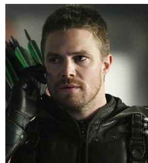
ARROW Interpreta Oliver Queen, que também tenta salvar sua cidade de males como a corrupção.