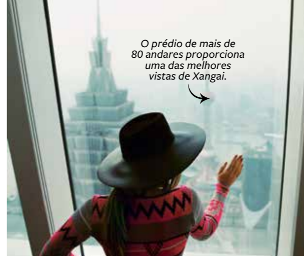
O prédio de mais de 80 andares proporciona uma das melhores vistas de Xangai.

“A viagem pelo rio cruza as cidades de Xangai, Puxi e Pudong. Conferir de outro ângulo a paisagem maravilhosa que eu via todos os dias pela janela do hotel foi uma experiência inesquecível, ainda mais por ter acontecido bem na hora do pôr do sol. Rendeu as melhores fotos da viagem.”