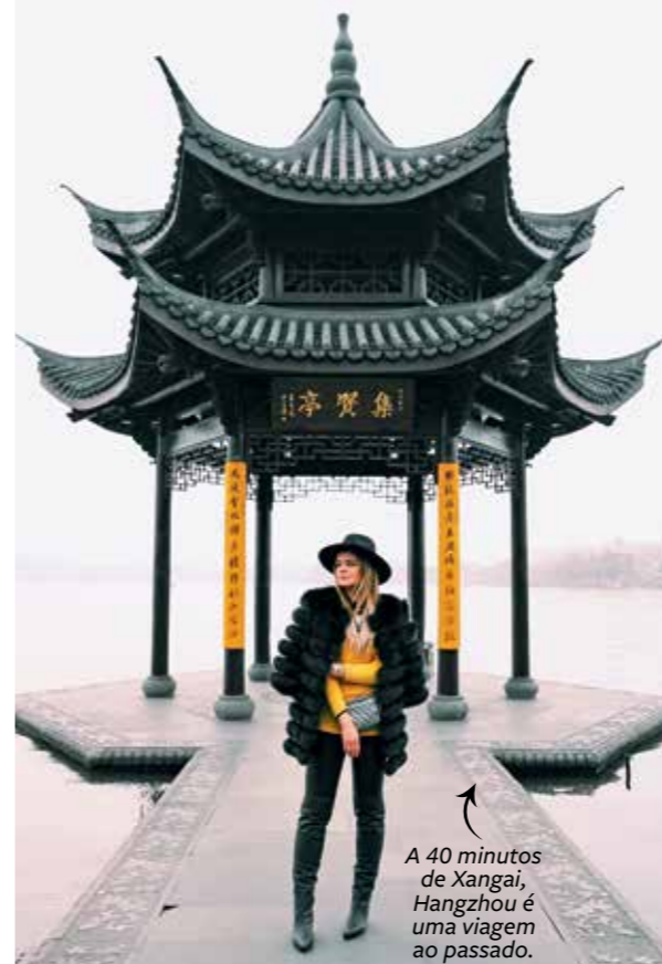
A 40 minutos de Xangai, Hangzhou é uma viagem ao passado.

“Já que estava na China, não queria ir embora sem conhecer uma cidade interiorana e tradicional. Peguei o trem-bala e, em 40 minutos, estava em Hangzhou. Apesar de ter 4 milhões de habitantes, o lugar é bucólico e cheio de parques e construções maravilhosas. Além disso, foi lá que a cultura do chá começou na China, ou seja, é obrigatório ir a algum lugar para degustar a bebida.”