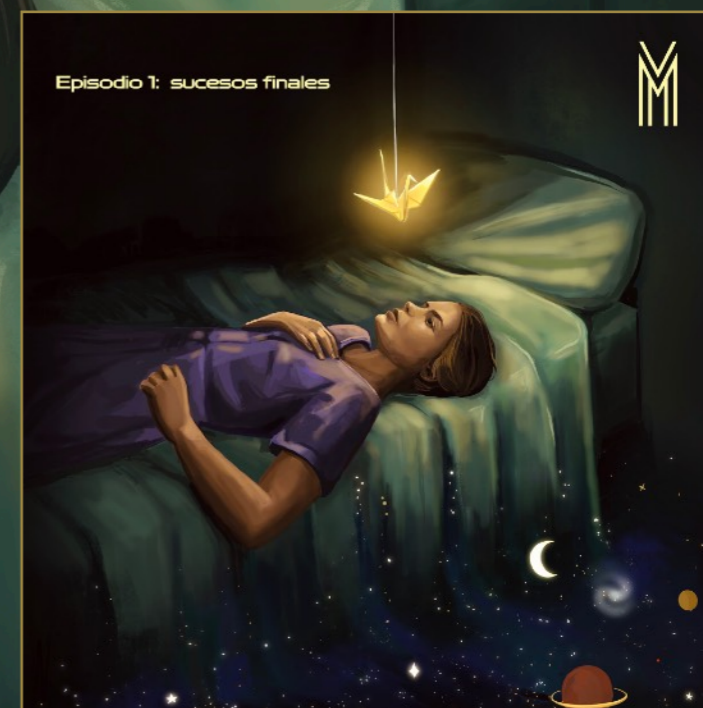
Episodio 1: sucesos finales (EP), 2023.

3 Voices Batalla Día de muertos Espectro Final Heart Machine Hidden Words Inferno Lonely Rider Mala Intención Metamorfosis Once On your lips (I tasted the lies) Spike The Escapist This Road