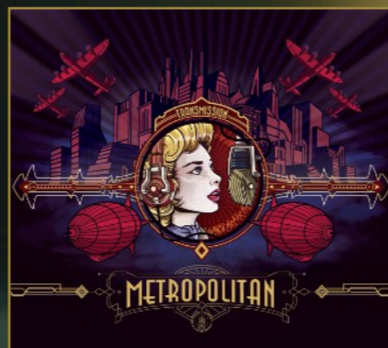
Transmission (EP), 2017.