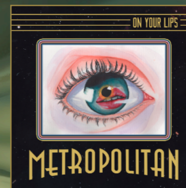
On Your Lips (Single), 2020.