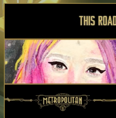
This Road (Single), 2020.