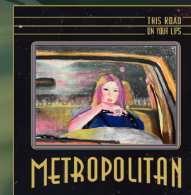
This Road / On Your Lips Vinilo 7" Record Store Day, 2020.