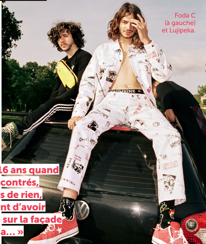
Foda C (à gauche) et Lujipeka.

F. NTM, IAM, Lunatic, PNL... Être comparé à des groupes comme ça serait un honneur. Tous ceux qui ont marqué le rap français sont des duos.