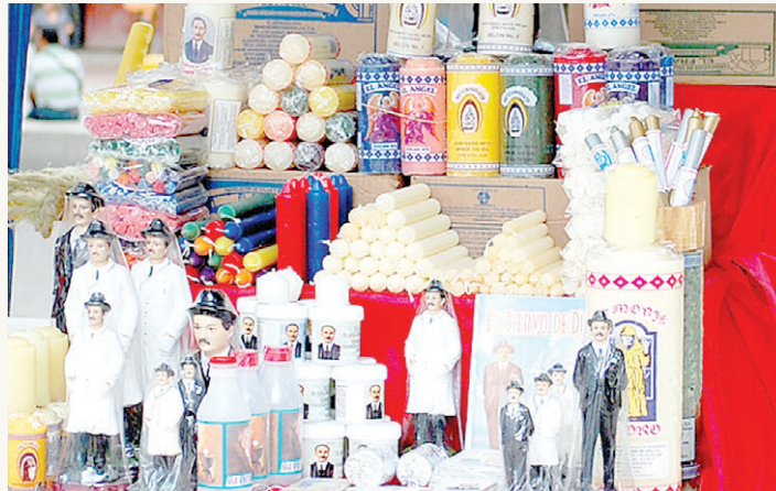
La vida y milagros del Doctor del Pueblo es objeto de culto no solamente practicantes del cristianismo católico sino también de otros cultos

habido una intercepción favorable de Jose Gregorio en su vida.