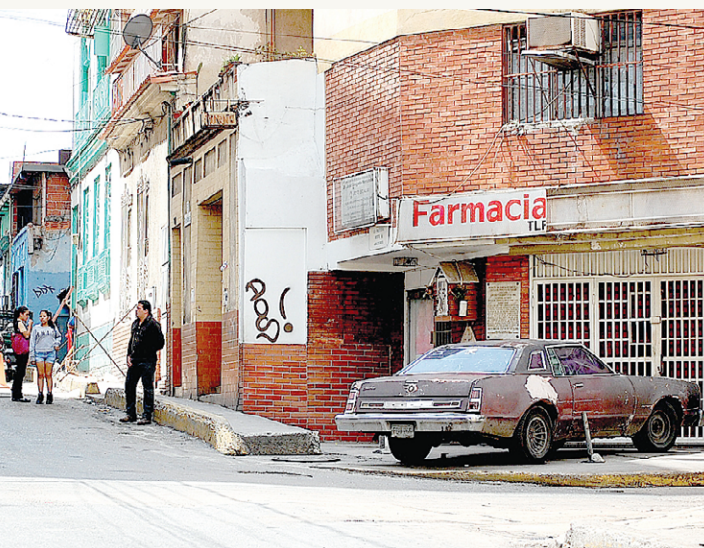
Esquina de Amador, donde murió arrollado el Dr. José Gregorio Hernández el 29 de junio de 1919, cuando salía de la botica tras comprar medicina para uno de sus pacientes

"El Instituto de Medicina Experimental de la UCV lleva su nombre porque fue el responsable de los inicios de la medicina expe-