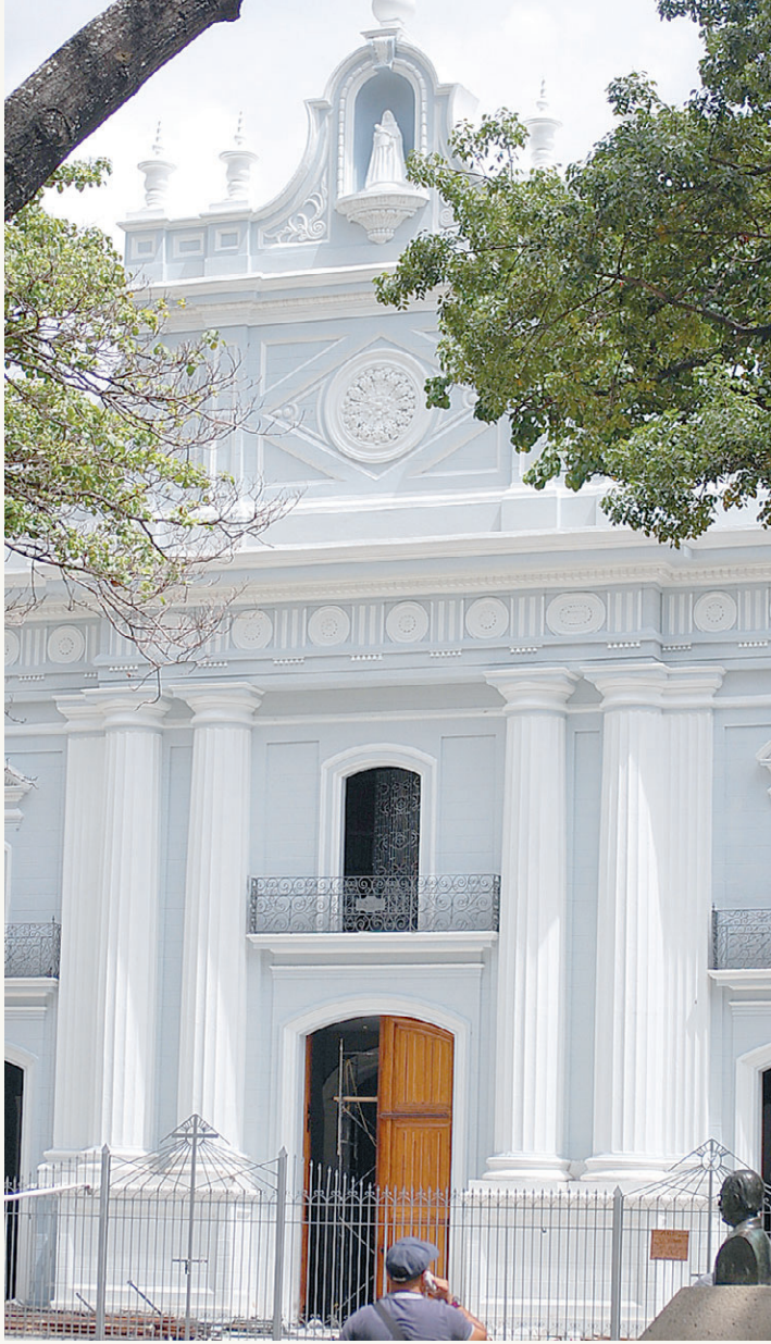
En esta Catedral descansan los restos del Dr. José Gregorio Hernández

Este domingo 26 de octubre es un día muy especial para todos los venezolanos, cuando se cumplen 150 años del nacimiento del Dr. José Gregorio Hernández, el Siervo de Dios.