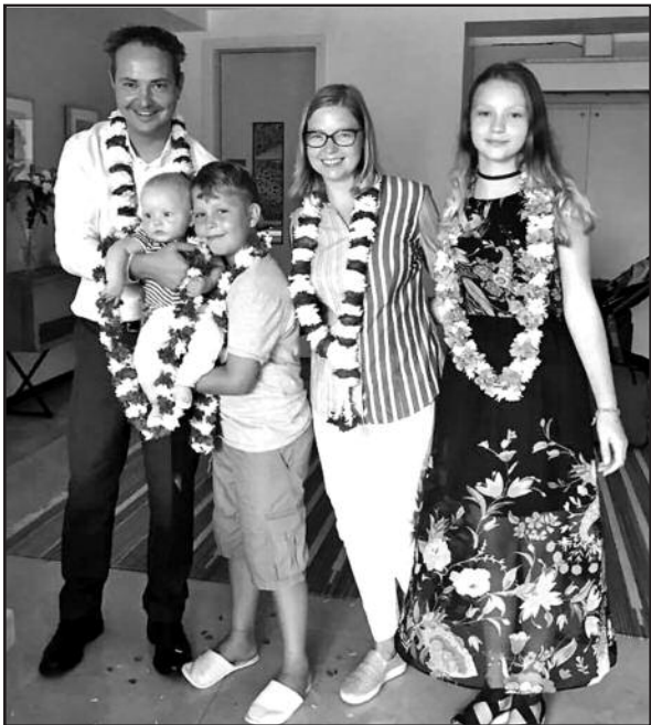
Pranevičių šeima – jau Indijoje.