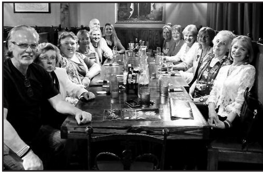
Po ilgos darbo dienos – bendra vakariėnė.