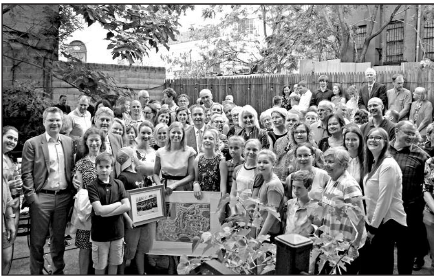
New Yorko lietuviai nuoširdžiai pamilo visuomet besišypsantį diplomatą.