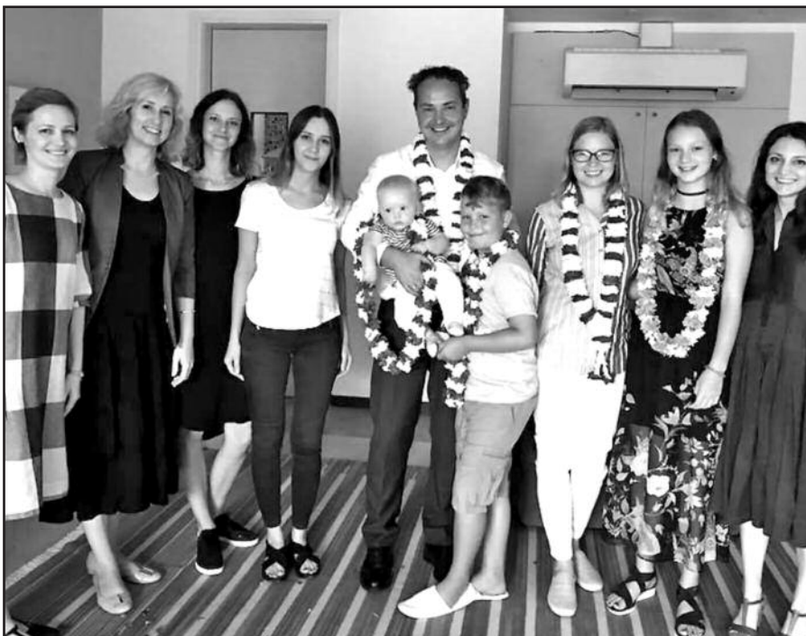
Pirmoji darbo diena ambasadoje.