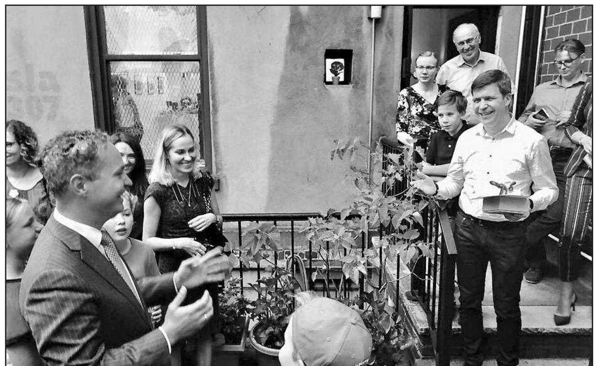
Mielam konsului – atsisveikinimo žodžiai ir dovanos.

Nuolatinis naujų žinių gavimas, įvairių sričių