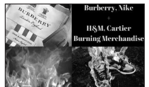
„Burberry“ nebedegins neparduotų gaminių.