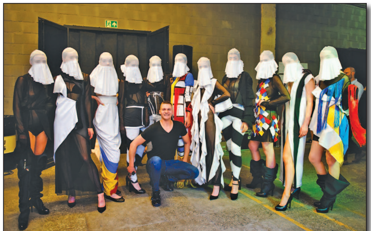
Dizaineris su savo modeliais.

Pirmiausia dėl šios mokyklos istorijos. Tai pirmoji Lietuvos dailės mokykla. Taip pat ir dėl to, kad čia mokėsi ir mūsų tautos pasididžiavimas, guru – Juozas Statkevičius. Ši asmenybė man taip pat im-