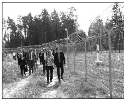
Apsauginė tvora, šiuolaikinės apsaugos priemonės leido žymiai sumažinti sienos pažeidėjų ir kontrabandos mastus.

Pripažįstant tarnybos kariuomenėje pridėtinę vertę visuomenės atsparumo ir gynybos potencialo stiprinimui ir įvertinus bendrą Lietuvos kariuomenės komplektavimą, modernizaciją, infrastruktūros plėtros galimybių ir poreikių situaciją, sutariama, kad 2022 m. bus sprendžiama dėl galimybės įvesti visuotinę karo prievolę.