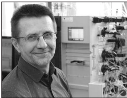
Vilniaus universiteto Biotechnologijos instituto mokslo tarybos pirmininkas prof. V. Šikšnys.