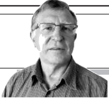
Parengė Vitalius Zaikauskas