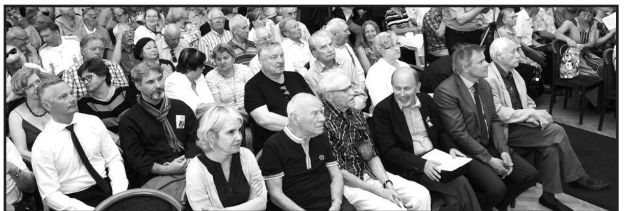
Sąjūdiečiai, kaip ir prieš trisdešimt metų, susirinko Lietuvos mokslų akademijos salėje.