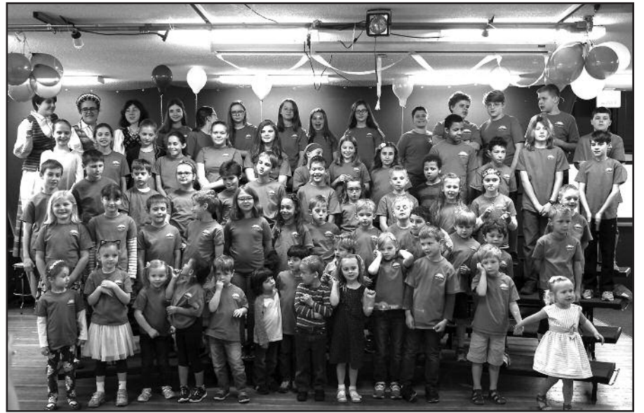
Mokslo metai mokykloje užbaigti gražia šeimos švente.

Dabar leidžiamės į vasaros malonumus ir laukiame kitų mokslo metų, kurie atneš daug naujų patirčių, nuo-