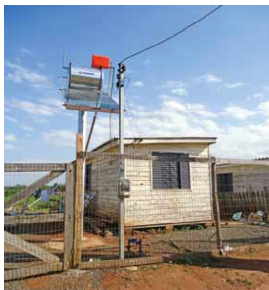
Coletor solar instalado em Canoas (RS)

QUATRO MIL FAMÍLIAS DE BAIXO PODER AQUISITIVO SERÃO BENEFICIADAS PELO PROJETO TRANSFORMANDO CONSUMIDORES EM CLIENTES, DESENVOLVIDO PELA COORDENAÇÃO DE PERDAS COMERCIAIS DA AES SUL ATRAVÉS DO PROGRAMA PLURIANUAL DE EFICIÊNCIA ENERGÉTICA. COM A SUBSTITUIÇÃO DE GELADEIRAS, CHUVEIROS E LÂMPADAS, REGULARIZAÇÃO DAS REDES EXTERNAS E INTERNAS DE ENERGIA, E INSTALAÇÃO DE COLETORES SOLARES, A CONTA DE LUZ DEVERÁ TER UMA REDUÇÃO DE CERCA DE 40%.