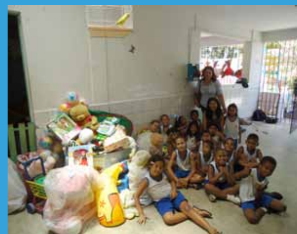
As doações da Filial Pernambuco foram destinadas à creche Casa da Esperança