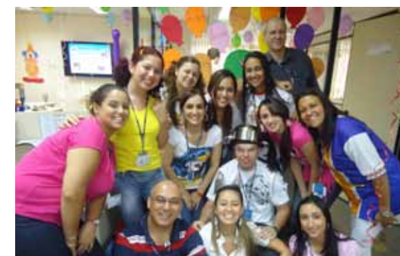
Equipe vencedora, devidamente caracterizada com o tema Circo

TEMA: RECORDAR É VIVER. A decoração ficou por conta de vitrolas, disco de vinil, jogos e brincadeiras. UP