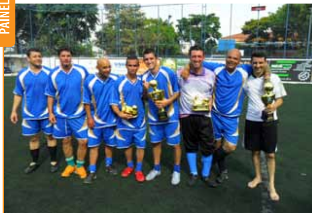
Time B comemora a conquista do 1º lugar

O 5º Festival de Futebol Society da Thyssenkrupp Elevadores – São Paulo – aconteceu em São José dos Campos, no interior paulista, no dia 12 de outubro. O campeonato contou com a participação de seis times: Filial Santo André, com os times A e B (16 jogadores); Filial São José dos Campos, com os times A e B (20 jogadores); Filial Ribeirão Preto, com um time (10 jogadores); e ITS – São Paulo – com um time (9 jogadores).