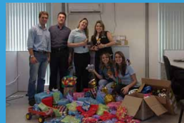
Colaboradores da Filial RS e seus brinquedos arrecadados

No mês de outubro, a TKEBr fez uma campanha solidária para o Dia das Crianças, com o mote “Com solidariedade os brinquedos ganham vida nova”. Além de fazer uma ação social, também deu um bom exemplo aos filhos dos colaboradores, que foram incentivados a doar seus brinquedos usados para fazer a alegria de outras crianças. UP