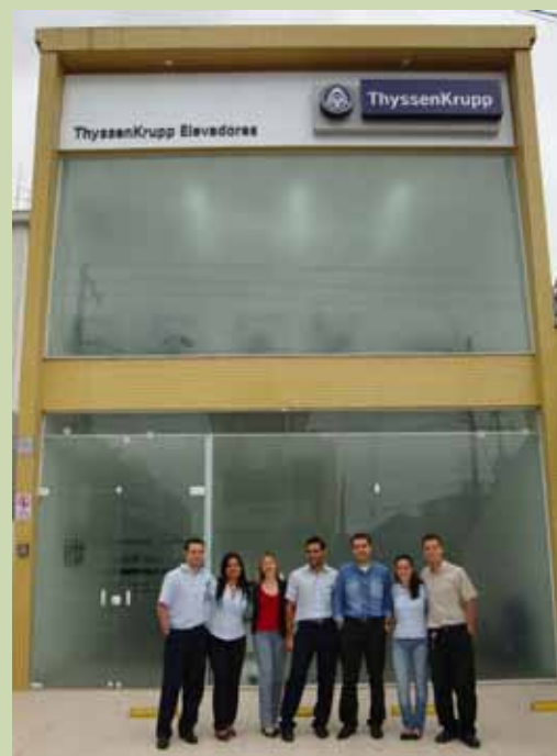
Colaboradores da Filial Santos (SP) em frente à nova sede.

A Filial Santos (SP) está de casa nova desde a primeira semana de outubro. A mudança de sede ocorreu devido ao crescimento da empresa na região. Além disso, o local antigo já não era suficiente para seus 60 funcionários. Agora, a nova filial é mais comercial, pois o novo endereço é localizado em uma avenida mais movimentada e importante da cidade, o que facilita a visita dos clientes. UP