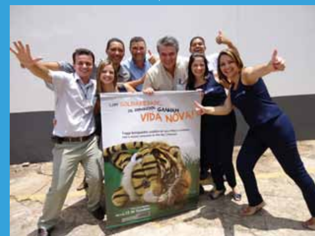
A Filial Brasília arrecadou 250 brinquedos que foram doados às crianças do Orfanato Nosso Lar, que atende 60 crianças