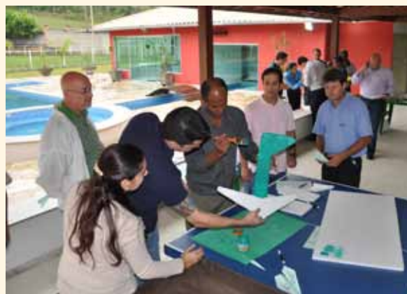
Dinâmica de grupo: colaboradores constroem avião de brinquedo

ção de um avião, mobilizou os 30 participantes. O objetivo era multiplicar os conceitos e estratégias trabalhadas no encontro nacional. UP